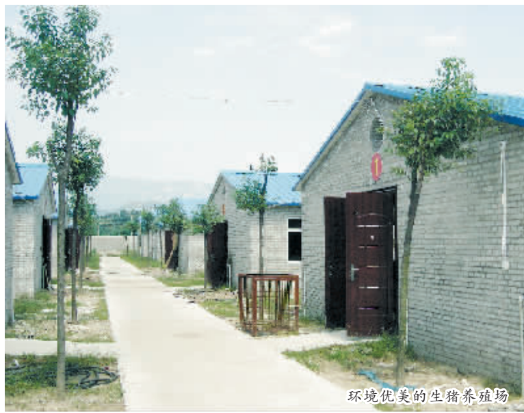
环境优美的生猪养殖场