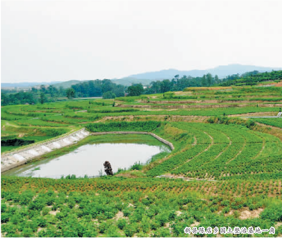
新县陈店乡国土整治基地一角