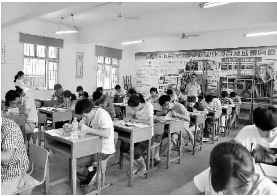
6月16日,我市2012年市直事业单位公开招聘工作人员笔试开考。市委常委、常务副市长冯鸣到考试现场进行巡视。据悉,今年我市55个市直事业单位将面向社会公开招聘工作人员368名,此次考试共设4个考点、118个考场,有3486人参加考试。图为考试现场。

5842元,较2006年3153元增加2689元,增长85.28%,年均增长率达17.1%。五年来我市农民人均纯收入年均增长达到两位数,农民收入稳定增长的长效机制正在形成。农村经济的快速增长,农民收入的明显提升,极大地缓解了基层干群关系。农民负担监督管理逐步规范,五年来,无重大恶性案(事)件和群体上访事件发生,很好地维护了农民的合法权益,促进了农村社会的和谐稳定。