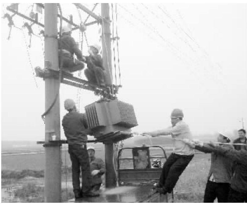
连日来,潢川县谯店乡供电所针对群众抗旱电力紧缺问题,战高温冒酷暑,无偿帮助群众进行电改,解决农村群众“三更”用电难问题,受到干部群众的一致好评。图为该所员工在牌坊村为群众安装变压器时的情景。

固始县南部山区与中部平原交汇地带,全乡面积65平方公里,辖15个村(居),153个村民组,2.8万人,是豫东南地区最大的固始鸡养殖和精品蛋集散地,南临宁西铁路固始站,北接阜阳国际机场,空运、铁运、公路方便快捷,是固始的“窗口”乡镇,有固始县南大门之称。 近年来,随着赵岗乡经济发展的持续加速,居民生活水平的不断提