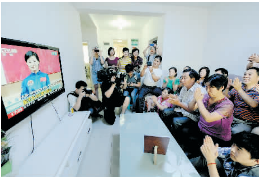
6月15日,神舟九号女航天员刘洋的家人在家中观看首次载人交会对接任务航天员与记者见面会的直播,为即将执行任务的三位航天员加油。