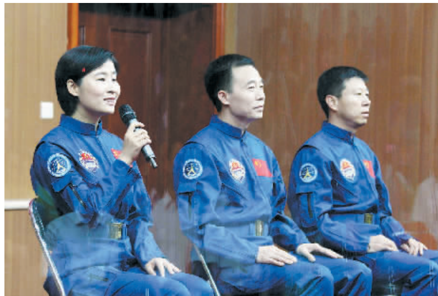
6月15日,刘洋(左一)在首次载人交会对接任务航天员与记者见面会上回答记者提问。