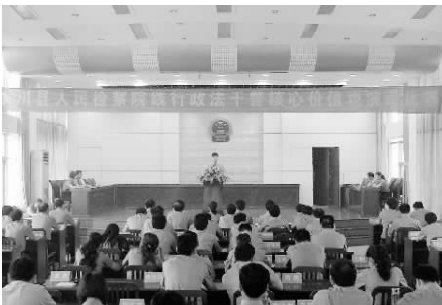
近日,潢川县检察院举办了践行政法干警核心价值观演讲比赛,15名参赛选手,紧紧围绕“忠诚、为民、公正、廉洁”为主题,阐述了政法干警核心价值观内涵的理解。