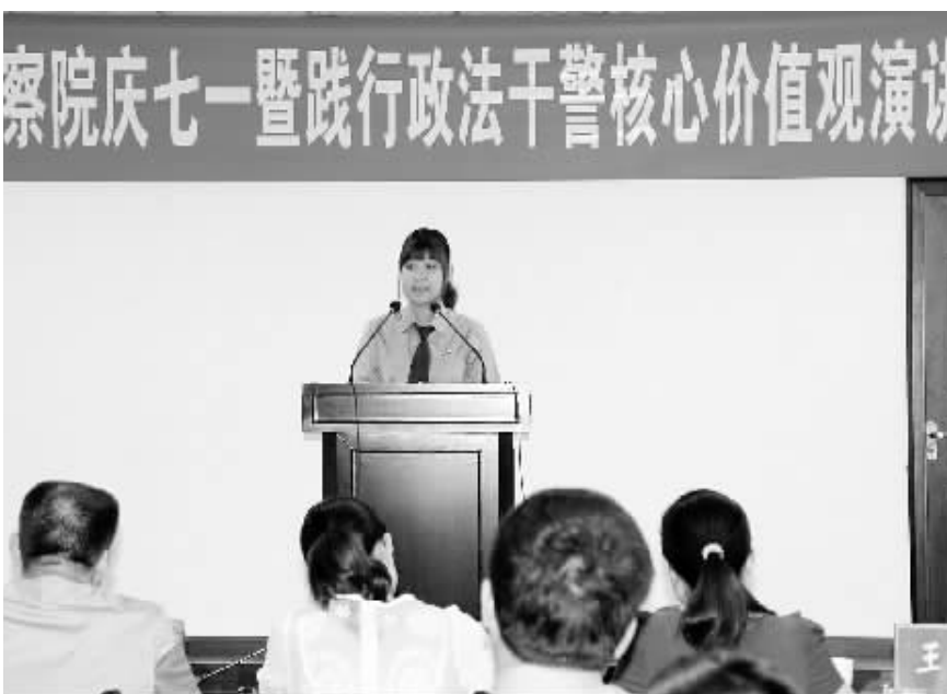
近日,息县检察院举办了庆“七一”暨政法干警核心价值观演讲比赛。该院通过搭建党员公开承诺、学习雷锋、关爱留守儿童、“五四”祭奠革命先烈、庆“七一”等载体,有效地促进了核心价值观教育实践活动深入开展。

填写派车单,真正做到“每车有单,无单不行”。各部门用车一律由用车人填写派车单,报请计财科审查,分管领导同意签字后,计财科负责对外出车辆进行统一调配。三是强化监督,注重成效。为切实加强加强对车辆管理使用和安全方面的监督检查,加强对警车使用管理的督察力度,采取一周一检查、一月一通报,发现违规问题及时进行通报批评和纠正处理。同时,定期对车辆进行统一的维护、修理,组织驾驶员进行业务比武,提高自身驾驶技能,取得了显著成效。