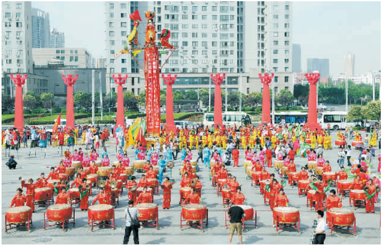
6月9日，在中国文化遗产日主场活动开幕式上，来自河南各地的非物质文化遗产展示队为观众表演。

“三夏”时节天气历来复杂多变，龙口夺粮、抢墒播种的任务仍然十分艰巨。农业部要求各级农业、农机部门进一步加快小麦机收进度，及时抢种夏播作物，切实做好“三夏”保障服务。