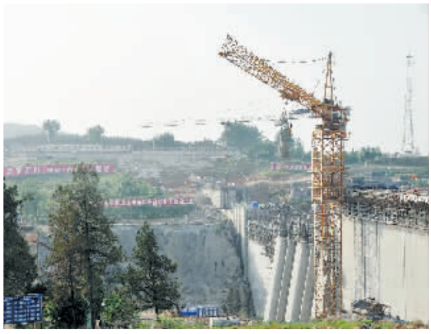
河南省各级政府、相关部门及广大工程建设者,在提高质量,加强质量管理的同时,采取有力措施,全速加快工程进度。截至目前,渠首枢纽工程坝高均完成在165米高程以上,部分坝高程达到176.6米设计高程,主体工程现已完成70%。

新华社郑州6月1日电(记者 李鹏)记者从河南省舞钢市获悉,继4月初该市向搬入新型农村社区的21户农民首次发放“集体土地使用证”和“房产证”后,5月30日,其中的10户农民又正式通过农房抵押贷款331万元。 据介绍,这款名为“兴万家社区居民特色贷款”的农房抵押贷款金融产品,由舞钢市农村信用合作社发放。根据这个信用的规定,只要农民持有农房“两证”,符合贷款条件,融资项目可行,就可由农信社受理,进行抵押贷款支持。为缩短审批时间,提高发放效率,“兴万家社区居民住房抵押贷款”还专设了“绿色通道”。 据透露,按照舞钢市的设想,这一做法今后将在全市推广。为突出支农特色,舞钢市农信社在贷款利率上,将给予农房抵押贷款同档次下调4个百分点的利率优惠,并由市财政对以农房抵押贷款用于创业的农户给予70%的贴息。同时,为控制农户小额贷款分散贷款及“农房流通受限”带来的抵押贷款风险,舞钢市还规定,将农房估值的70%为抵押贷款上限,并专门由财政出资成立了风险补偿基金以对冲该项贷款可能为金融机构带来的风险损失。 据介绍,舞钢市通过将农民最重要资产农房由过去的“死资产”变为“活资本”,有望缓解困扰农村发展的金融供给不足问题。