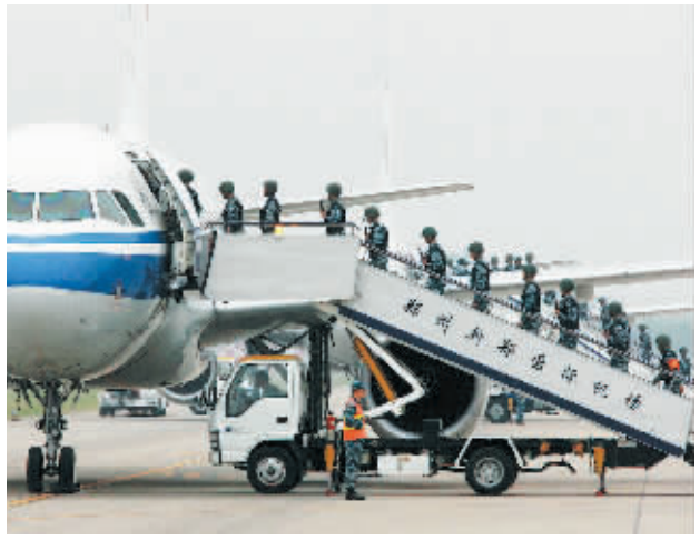
近日,高原驻训官兵正在郑州新郑国际机场快速登机。近年来,空军在动用民航运力运送部队人员、物资和装备上进行了积极探索,积累了一定经验。下一步,他们将采取在国有大型航空公司抽组预备役航空运输机队、派驻军代表等措施,进一步增强军地一体的航空运输能力。