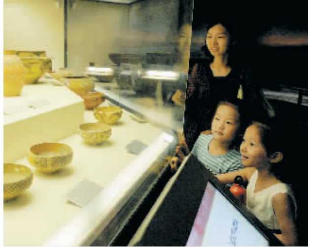
6月1日,一位家长带孩子到河南省博物院展览厅参观。在“六一”儿童节,许多家长带孩子走进河南省博物院,感受历史、增长知识,度过快乐“六一”假日。