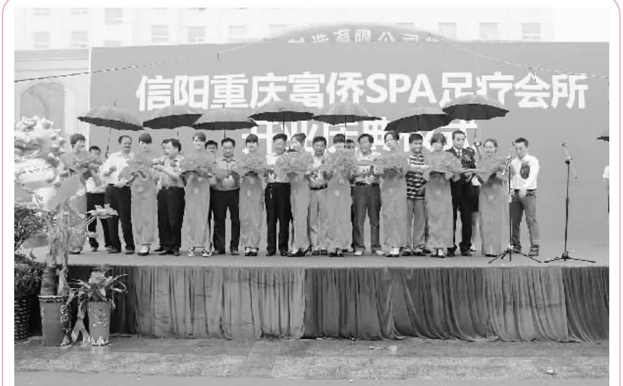
5月29日,位于信阳中州国际饭店3楼的重庆富侨SPA足疗会所正式开业。重庆富侨会所主要经营足疗、泰式推拿、肾经保健、亚健康理疗、高端SPA等项目。

“得正”牌蜂蜜凉茶用料除了精选茶叶和深山蜂源地原生态蜂蜜外,还辅以纯天然夏枯草、菊花、荷叶、金银花、桑叶、仙草、罗汉果等地道中药材提取物之精华。