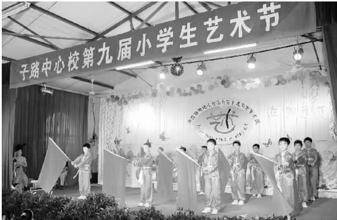
日前,罗山县子路中心校举办了主题为“在阳光下成长”的第九届小学生艺术节文艺汇演,来自全镇15个村小及镇幼儿园的280多名小演员、师生等近千人参加了活动。图为文艺汇演现场。

本报讯(吴健敏 余运军)5月30日上午,平桥区三小与查山乡中心小学“欢庆六一,共享阳光”城乡少年手拉手活动在查山乡中心小学隆重举行。此次活动由平桥区妇联、区教体局和查山乡人民政府联合举办,平桥区委、区政府、区总工会有关领导以及区直相关部门负责人参加了活动。 活动在庄严的升国旗仪式中拉开帷幕,献词《放飞希望》、舞蹈《飞向祖国的四面八方》、歌曲《学习雷锋好榜样》、情景剧《闪闪的红星》、歌伴手语表演《感恩的心》等精彩的节目,给人们留下了深刻的印象。城乡孩子们同台演出,放声歌唱,歌颂伟大的党,歌颂伟大的祖国,歌颂可爱的家乡,尽情地抒发自己的情感。 开展手拉手活动,不仅增进了城乡孩子们的相互了解,增进了友谊,更让孩子们感受到了社会对他们的真情关爱,同时也增强了他们自立自强、努力学习、增长才干的信心和决心。