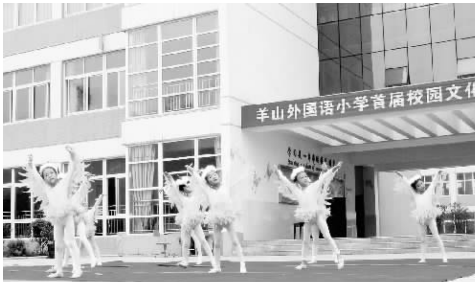
近日,羊山外国语小学举行了首届校园文化艺术节。本届校园文化艺术节包括美术作品展、乒乓球比赛、手抄报、绘画作品展、教师书法展及文艺汇演六大活动板块。图为文艺汇演现场。

我知道,再灿烂的话语也只不过是过一瞬间的智慧与激情,朴实的行动才是开在成功之路上的鲜花。东晋大诗人陶渊明有一首诗曰:“盛年不重来,一日难再晨;及时当勉励,岁月不待人。”故而从感叹中清醒,把握时光,珍视今日,用激情浇灌心灵,充实人生的脚步,时刻感受辛勤拼搏的幸福。 大学生生活是热情奔放的,大学生活是五彩缤纷的,大学生活是催人奋进的。人生最如花的年龄是在大学中走过的,虽然不知道未来还会有什么艰难险阻,但我始终相信,只要努力下一站就是幸福。