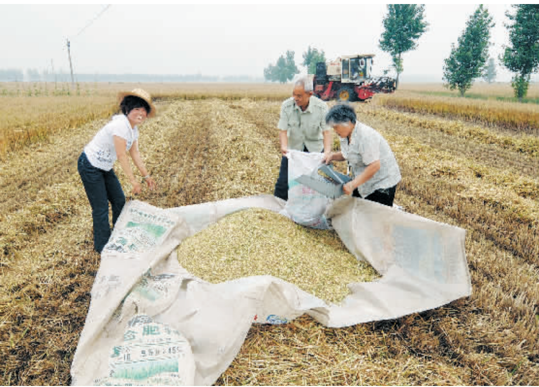
5月27日，河南省驻马店市遂平县大王台村村民准备将收割好的麦子搬走晾晒。目前，河南省的7990万亩冬小麦由南至北相继成熟，广大农民开始适时抢收冬小麦。河南省夏粮抢收和夏播工作由此拉开序幕。

“荷锄也可弄丹青，不描花草画虎雄。”王公庄的农民们，用荷锄下地的手绘出了老虎大产业，他们的智慧仍然在延续。王公庄作品正由单一的工笔画向油画、烙画、麦草画、团扇、册页拓展；对绘画作品进行精加工，如精裱、精包装、制作浓缩式的旅游绘画作品；涉虎相关产品也在开发中，如布老虎、虎头靴、虎头枕、画框、字画装裱等。这座总人口1300余人的村庄，现有虎头帽、虎头枕作坊8家，字画装裱店6家。 据介绍，王公庄制订出最新发展规划，准备用3年时间形成2000人至3000人的稳定绘画主力军，年创作作品20多万张，年收入突破1亿元。逐步实现王公庄由文化产业发展示范地向全国著名的工笔画创作、销售集散地和文化旅游景区的转变，建成在全国有影响的书画产销基地、绘画人才培养基地和画家创作基地。 (新华社郑州5月27日电)