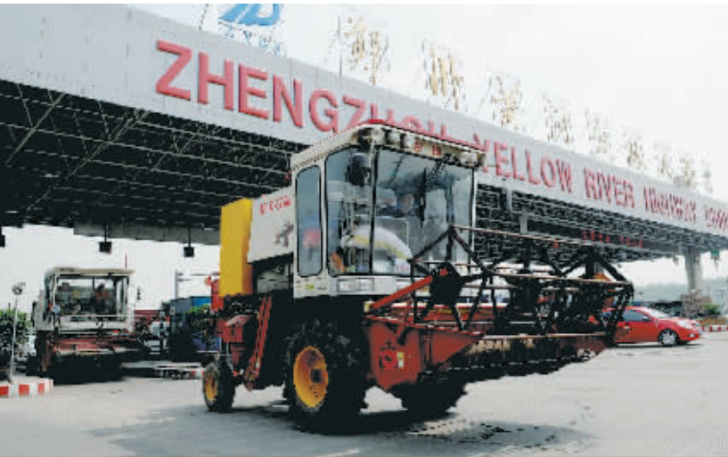
5月27日，来自河北的“麦客”免费通过郑州黄河公路大桥收费站。近日，随着2012年河南省麦收工作的开始，黄河以北地区的大批机收“麦客”陆续由北向南到黄河以南地区参加麦收会战。据了解，河南各地各相关部门已全部开启“三夏”麦收绿色通道，启动激励机制提供优质服务，确保机收“麦客”畅通无阻。