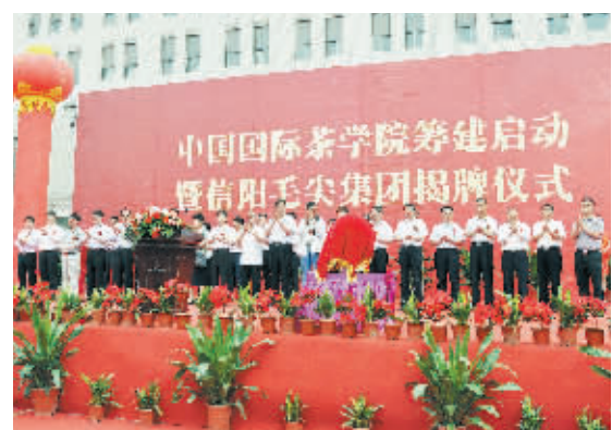
中国国际茶学院筹建启动暨信阳毛尖集团揭牌仪式现场