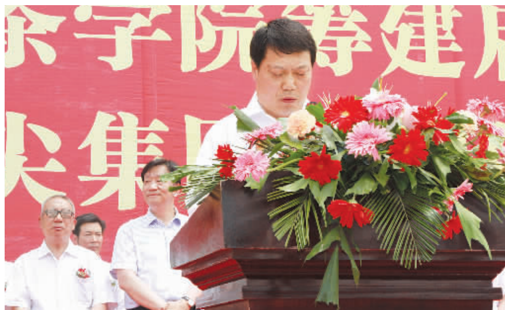
信阳市政府副市长郑志强在仪式上讲话