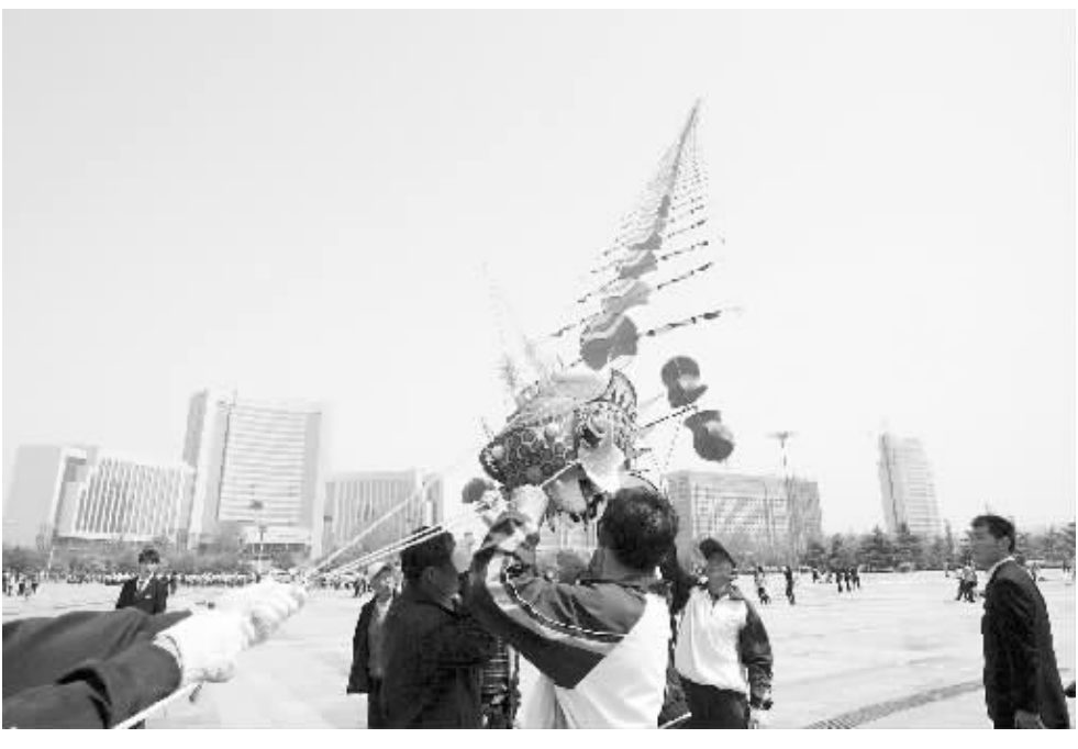
4月27日,人们在潍坊市人民广场放飞“蜈蚣”风筝。当日,山东省潍坊市万人风筝放飞活动在潍坊市人民广场举行,市民放飞五颜六色的风筝,迎接即将到来的“五一”国际劳动节。