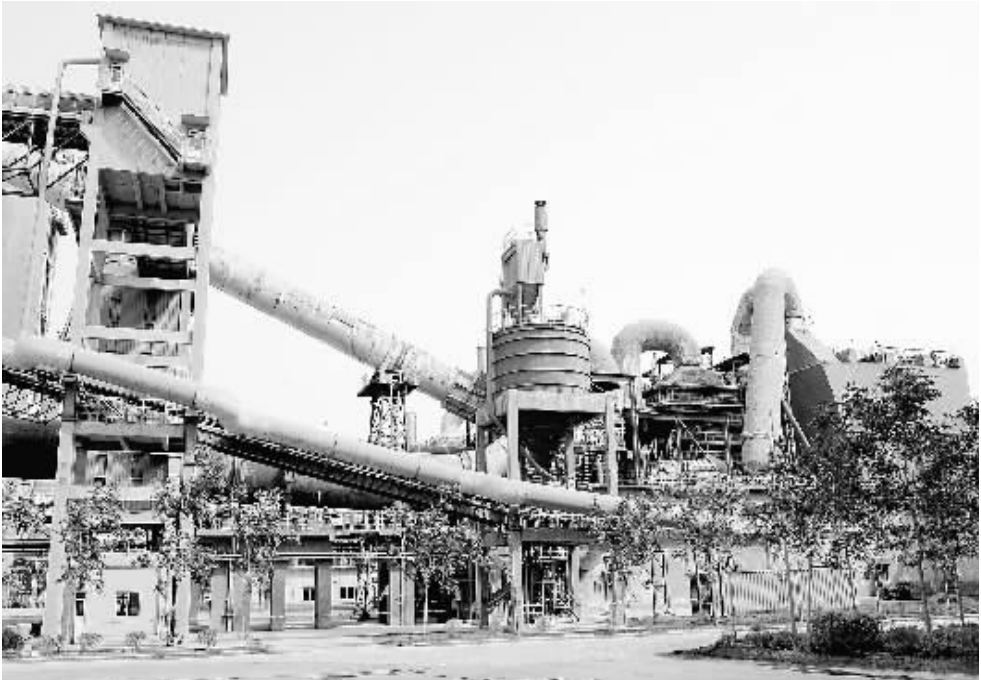
这是新型干法水泥生产线协同处置生活垃圾示范工程垃圾焚烧系统。4月27日,河南首条利用新型干法水泥生产线协同处置生活垃圾示范工程投产。