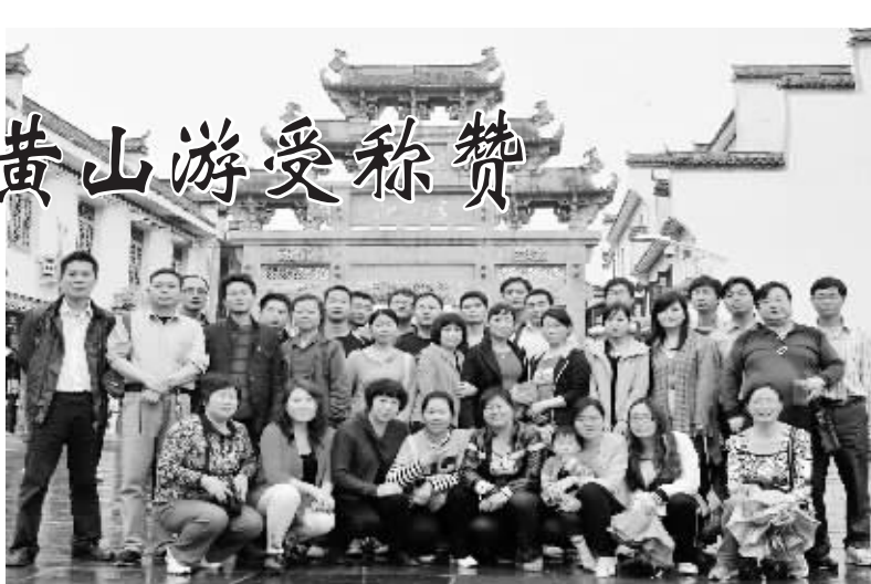
图为大河假期旅行社婺源江湾风景区合影留念。

在黄山刚好赶到雨雾天气,但是此团游客们兴致不减。湿滑的台阶、雨雾天气,加上带有两岁的小孩子,让黄山之行异常艰难,但是大家在导游的带领下,所