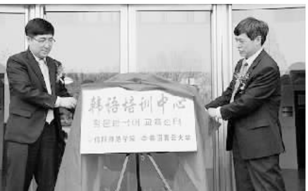
日前,信阳师范学院·韩国青云大学韩语培训中心揭牌仪式举行。据悉,信阳师范学院与韩国青云大学于2010年签订合作协议,合作期间,双方在拓展办学项目、提升办学层次、加强留学生教育等方面取得了可喜成绩。

本报讯(姜冬玲)开学以来,市特殊教育学校党支部一如既往地开展创先争优党员学习生活。该校党支部精心组织,本着“突出主题,结合实际,力求实效,全面推进”的原则,注重“五个结合”。一是主题学习与自我学习相结合;二是辅导学习与自我学习相结合;三是自主学习与实践相结合;四是集中学习与分散学习相结合;五是理论学习与专业促进相结合。