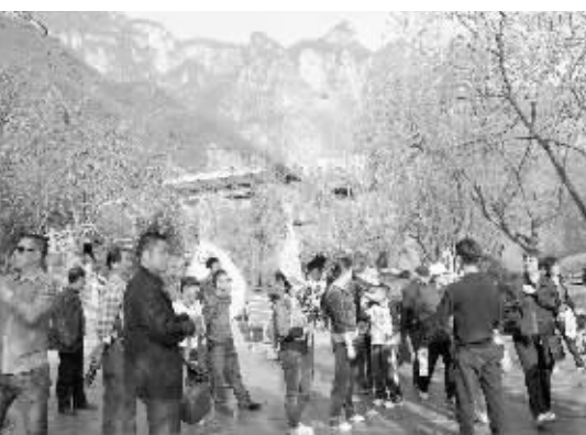
图为车友们在欣赏云台山风景。