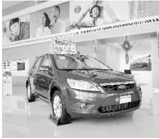
图为福克斯三厢。

本报讯(记者 曹政)记者日前在福特汽车信阳威通店采访时获悉,为迎接新款福克斯上市,三厢福克斯促销活动也悄然揭幕。据悉,长安福特信阳威通店于4月10日至15日开展以“约惠春天”为主题的促销活动。据该店市场部负责人介绍,活动期间凡试驾经典三厢福克斯客户,凭试驾协议均可领取奥斯卡电影票一