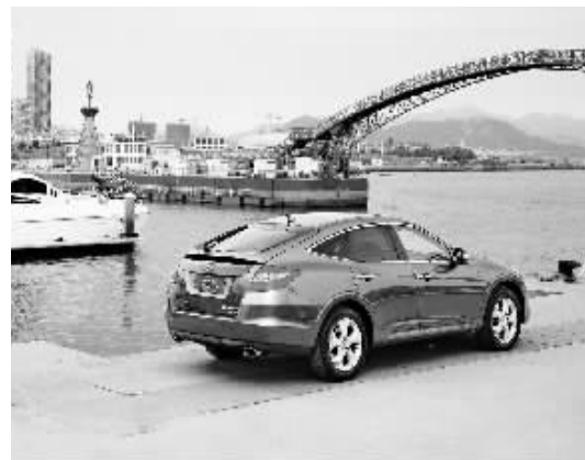
图为歌诗图2.4L。

据信阳悦达起亚店市场部负责人介绍,本次自驾游活动加深了车友和4S店之间的沟通和交流,促进了东风悦达起亚车友对起亚品牌的认可度,对4S店的口碑和品牌推广起到了积极的推动作用。