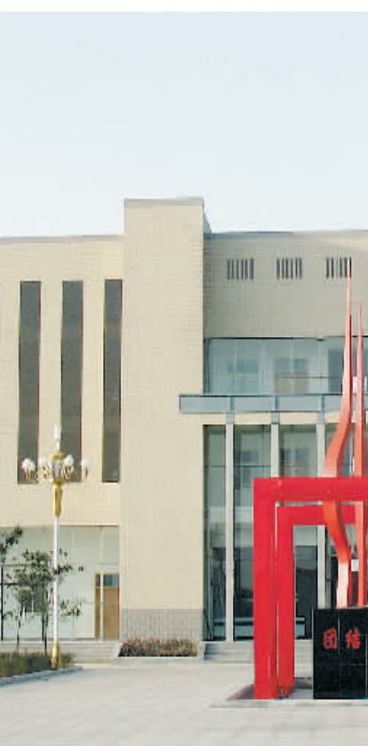
江湾村便民服务中心

江湾村在制定社区建设规划上坚持高起点、高标准、高品位,走出了农民居住社区化之路;在土地流转上服务于农业产业化,以规模化经营为宗旨,走出了生产经营合作化之路;在推动农业产业发展上坚持因地制宜、特色带动,向立体