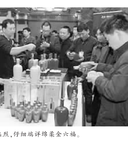
经销商现场反响热烈,仔细端详绵柔金六福。