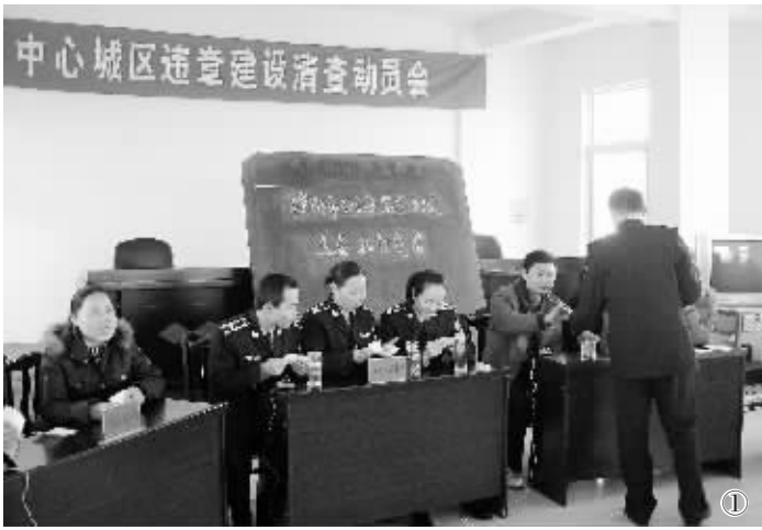
在全省住房城乡建设系统开展“管理提高年”活动中,市城建监察支队注重行政执法队伍规范化建设,坚持依法行政、强调文明执法,持之以恒地组织系统的学习培训,受到省住房城乡建设厅的表彰。