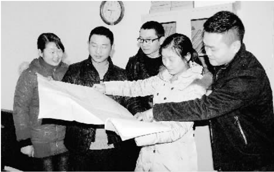
去年以来,担负城市规划区内规划资料、地形资料、建设项目规划审批资料的市城市规划设计院,提供规划档案资料856卷(次),复印各类档案912张,查询准确率100%。