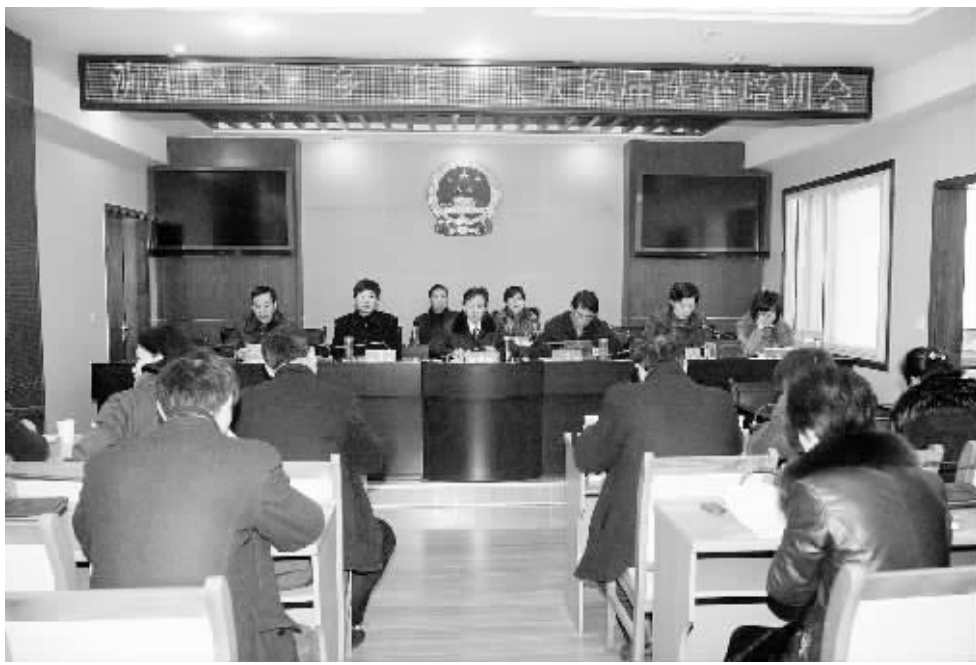
为进一步做好人大换届选举工作,处理好激发选民参选的积极性和组织选民依法有序参与的关系,2月16日,涉河区举办区、乡(镇)人大换届选举培训会。图为培训会现场。

张春香强调,要进一步提高对文化旅游产业的认识,把文化旅游产业发展摆到县委、县政府重要工作上来布局和谋划。要真正把文化旅游当成“产业”来抓,拿出一批历史文化旅游项目研究、论证,走出去招商,要把1/3的时间、人力、财力用来做文化旅游项目。张春香强调,发展文化旅游产业要保障有力。领导要“包”项目,部门要“保”项目,要用一切政策激励、扶持文化旅游项目建设。