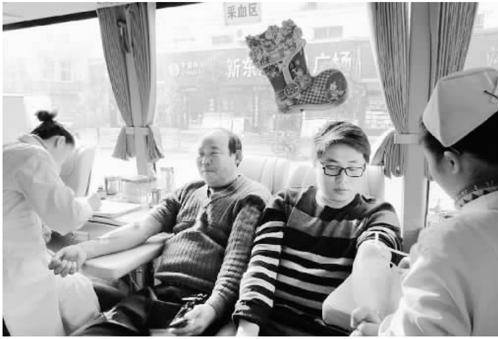
近日,河南息县电业总公司组织员工在该县谯楼街人民广场参加义务献血活动,以实际行动向社会奉献爱心。图为献血现场。