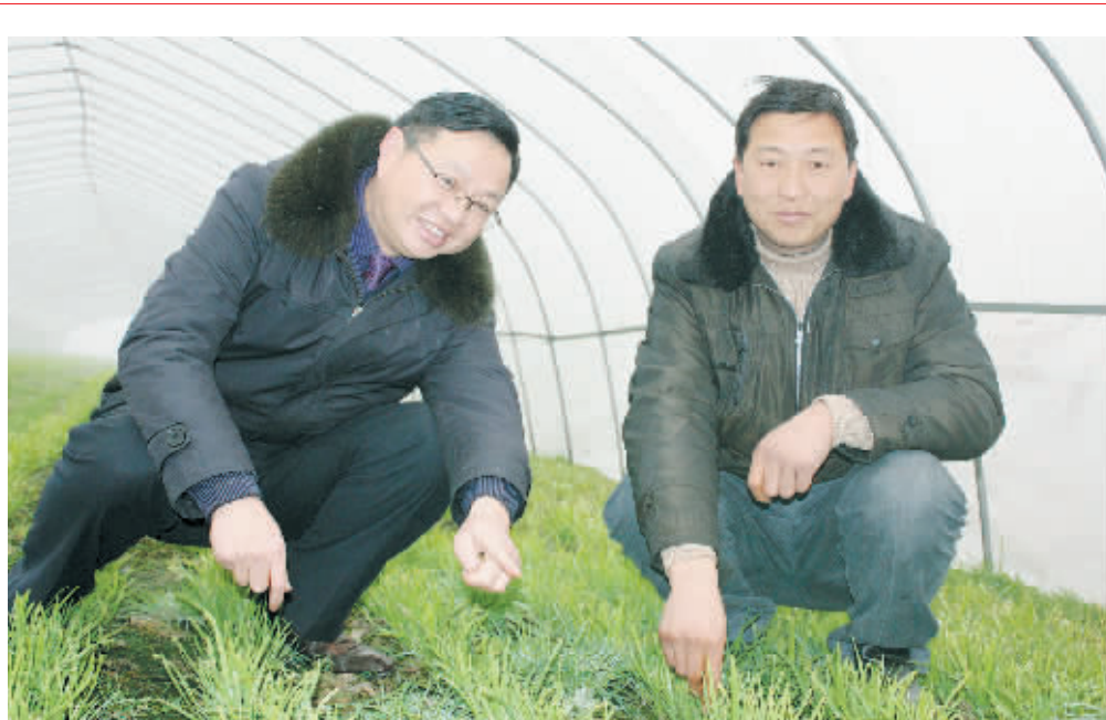
图为该公司技术人员在大棚里查看韭菜的长势。