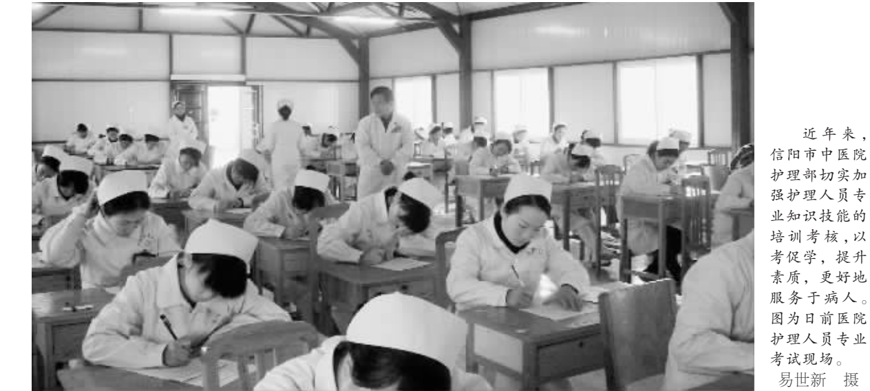
近年来,信阳市中医院护理部切实加强护理人员专业知识技能的培训考核,以考促学,提升素质,更好地服务于病人。图为日前医院护理人员专业考试现场。

失,下床行走自如,病人非常满意。据悉,市中心医院已聘请王福根教授作疼痛科客座教授,定期来院指导疼痛临床、科研和教学工作,定期开展国内前沿新技术,造福信阳人民。