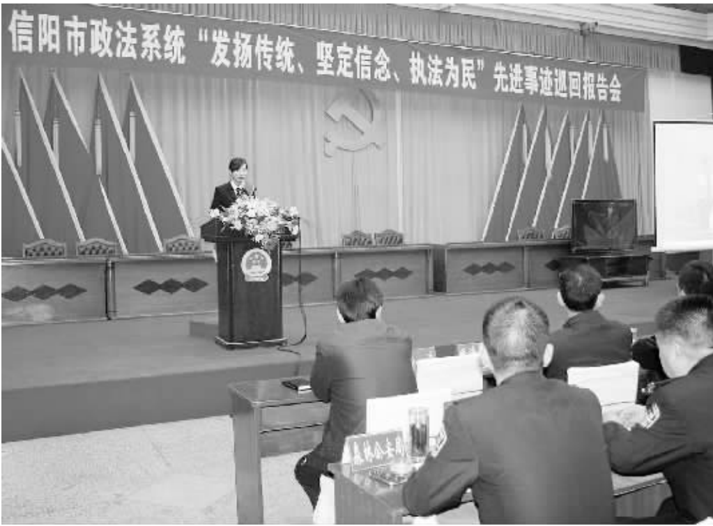
日前,全市政法系统“发扬传统、坚定信念、执法为民”先进事迹巡回报告会分别在各县区举行。报告会上,8名基层政法干警用朴实的语言和真挚的情感,真实生动地介绍了自己立足本职岗位、践行党的宗旨、执法为民的先进事迹。图为息县报告会现场。

开展便民活动 落实利民措施 市司法局在全市公证机构中开展“让人民满意活动”、“公证行业行风建设活动”,采取向社会公开“十项服务承诺”,发放“便民联系卡”、法律服务质量监督卡,向社会公示“公证办理流程、收费标准”、“公证事项投诉须知”,开设便民服务窗口,设立意见箱,为困难群众开辟绿色通道等措施,积极开展为老、弱、病、残等弱势群体上门服务,扎实推进公证便民、利民七项措施,强化便民、利民服务意识,改进工作方式与方法,提高