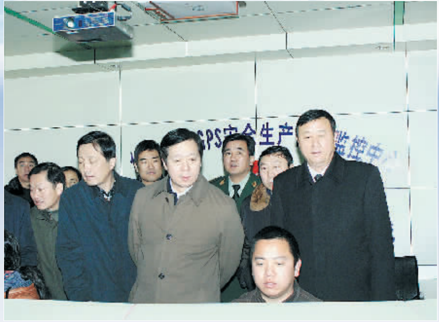
市长郭瑞民在信运集团领导的陪同下指导春运安全工作。