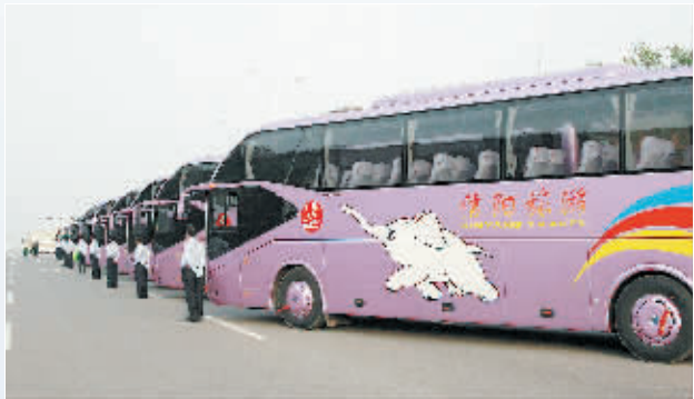
旅游公司豪华车队