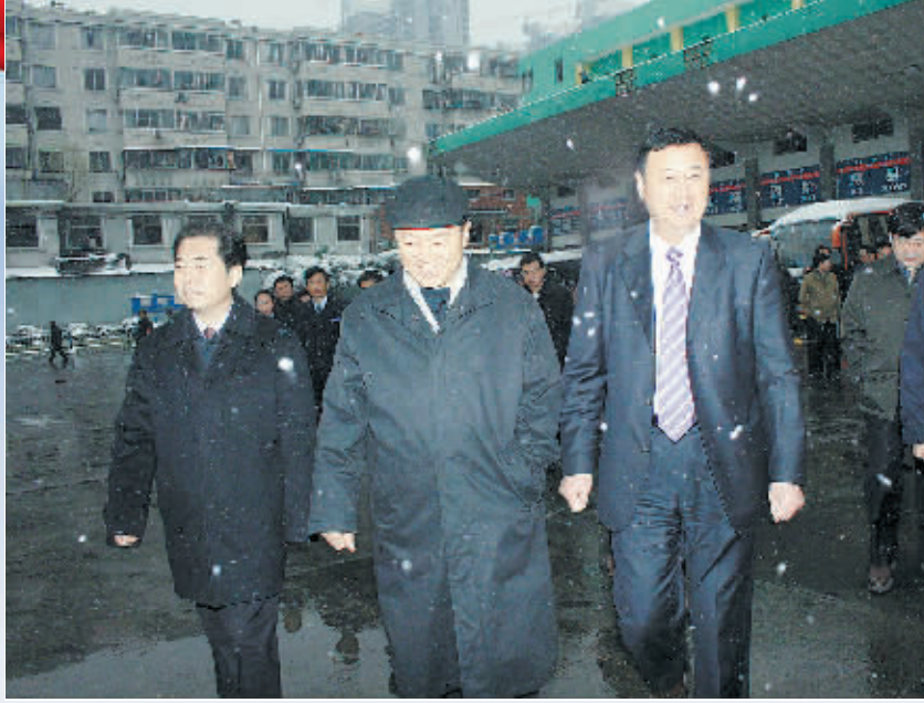
交通运输部副部长徐祖远(右二)视察信运集团安全工作。