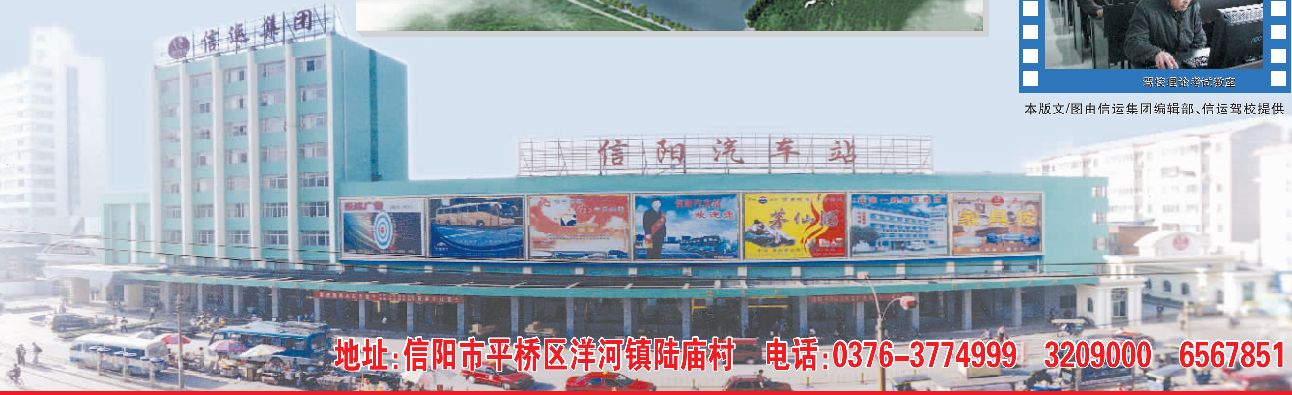
本版文/图由信运集团编辑部、信运驾校提供

地址:信阳市平桥区洋河镇陆庙村 电话:0376-3774999 3209000 6567851