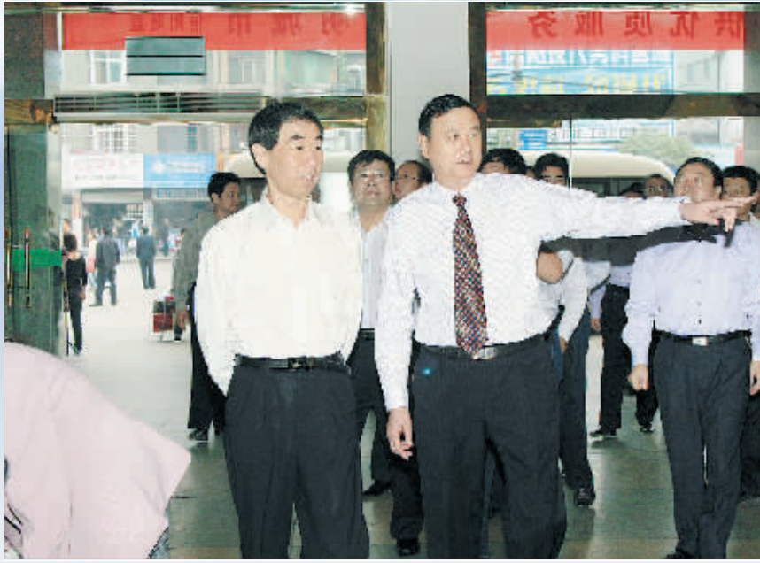
市委书记王铁(左一)视察信运集团,信运集团董事长阮中杰(前排右一)陪同。