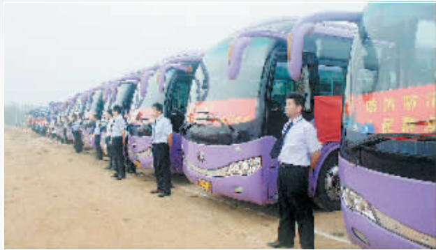
参加市抗洪抢险演练