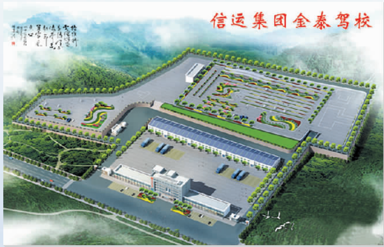
信运集团金泰驾校

物流园是信运集团物流园区新建的3000平方米钢结构的物流仓库。信运集团物流公司成立于2004年,是对原零担货运快件公司进行整合扩建后成立的大型物流公司,拥有各型货运车辆500余台,仓储面积1万平方米,堆场面积6000平方米。与河南省金象物流、路港物流、河南保税区物流港、郑州东栈物流园、湖北华中物流公司等多家省内外大型物流合作,物流网络通达全国各地,方便快捷。在我市设物流分点12个,其中,与我市建材港合作,配套改建仓储面积2000平方米,为建材港多家商户开展资金流、配送、仓储、装卸一站式服务,大大降低了商家的经营成本,充分发挥了物流功效。2006年,经中国物流采购联合会评审,该物流公司被评为AAA级物流企业,是目前我市唯一一家AAA级物流企业。