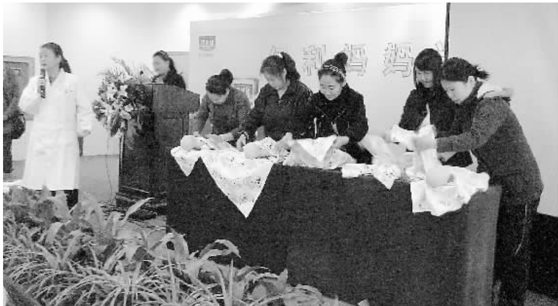
近日,市第一人民医院暨市妇幼保健院携手郑州大学三附院暨河南省妇幼保健院的专家,在阳光宾馆举办了一期孕妈妈培训班,数十名准妈妈准爸爸参加了这次培训。培训班全面介绍了孕产保健知识以及宝宝营养健康常识。图为准妈妈们在培训班上学习为宝宝穿衣服的情景。

市中心医院共有16项作品参加信阳市初赛评审,每一个创新项目都思路新颖,创意独特,贴近临床。该院张郁秋申报的“约束性加压袋”在获得信阳市大赛一等奖之后,代表信阳参加省级比赛并进入全国决赛。经过赛前认真的准备,赛中严谨详实的产品介绍和真人演示,参赛项目“约束性加压袋”最终得到大赛评委的一致好评,荣获大赛三等奖。