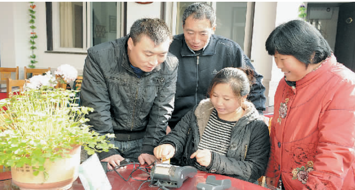
11月10日,在天津蓟县毛家峪一个农家院,村民在练习使用POS机结账。10月1日起,天津市农行为11个区县农家院免费安装了265台POS机...

中华五千年文明史表明,每一个文化高峰期都是文化创作活跃期和文化精品涌现期。在推进中华民族伟大复兴的今天,广大文化工作者自觉担当使命,紧紧依靠人民,抓住机遇奋发力充分迸发,推动标志性文化作品创作。