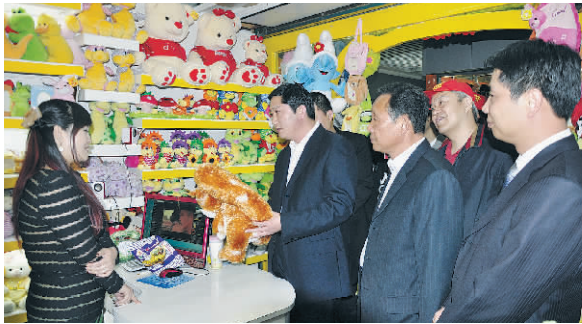
考察团成员在玩具商铺调研