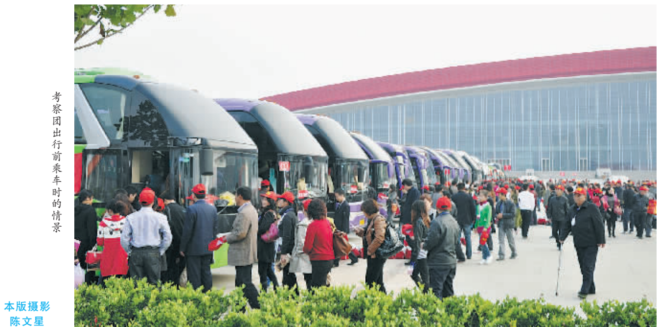
考察团出行前乘车的场景