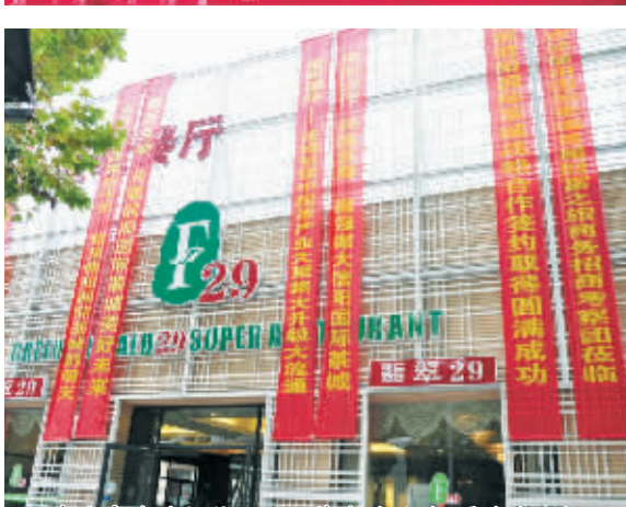
义乌小商品市场各分区电子屏上打出欢迎字幕