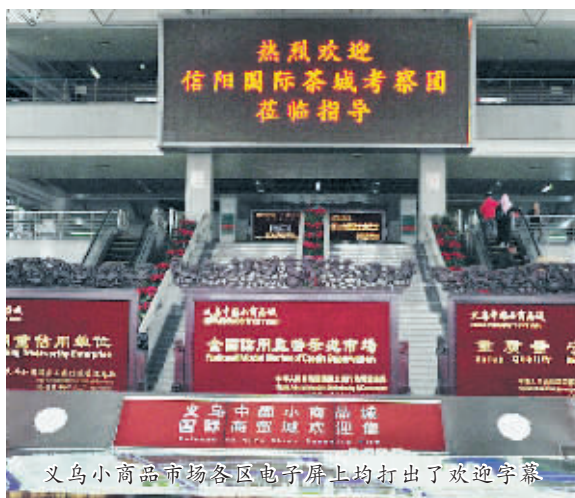
信阳国际茶城考察团在百花园举行隆重出行仪式