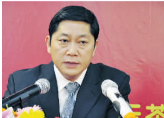
信阳市政协副主席、市工商联主席李正军介绍信阳茶情