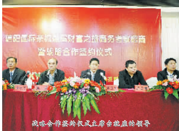
战略合作协议签约仪式主席台就座的领导