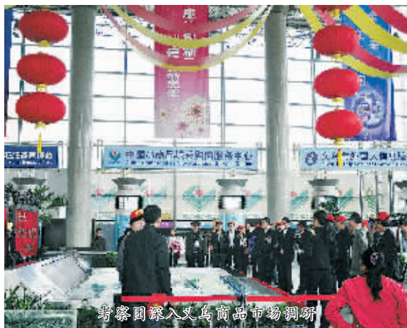
考察团深入义乌小商品市场调研