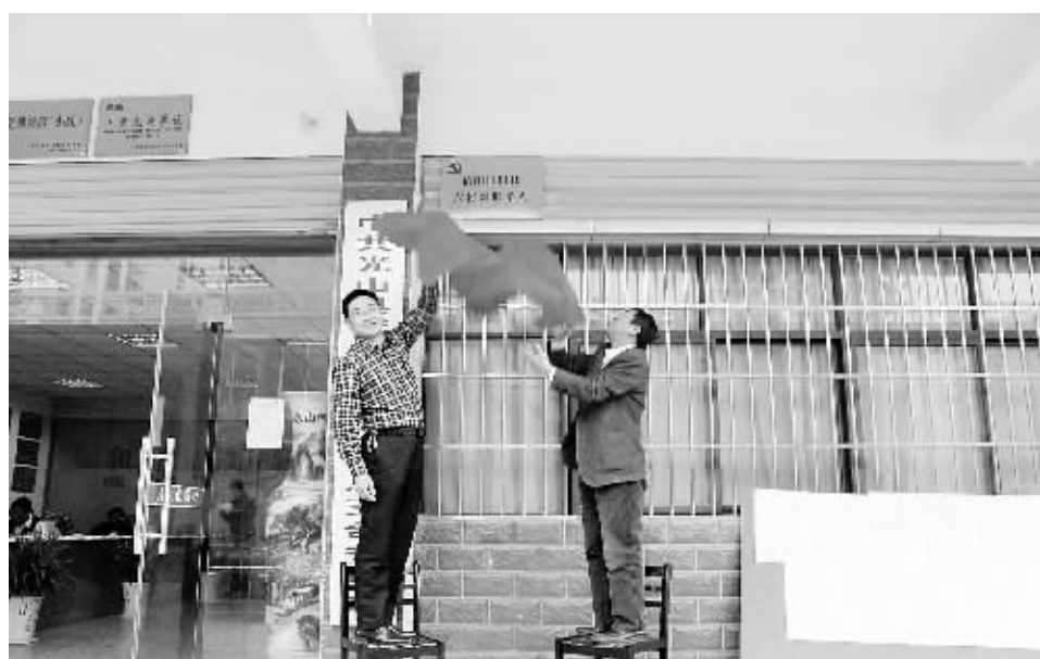
10月18日,《信阳日报》新农村新闻部“走基层、转作风、改文风”光山县联系点,在该县紫水街道办事处和平街居委会正式挂牌。