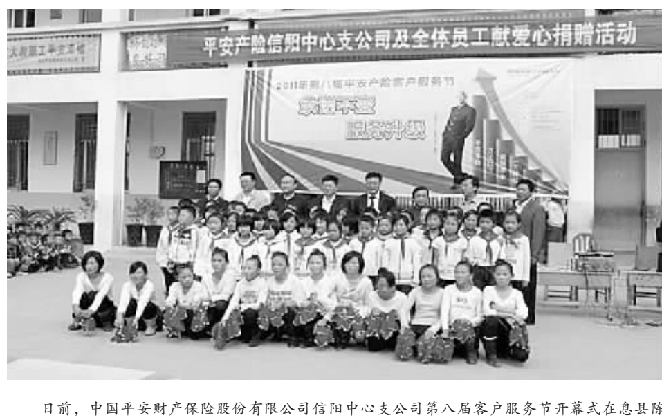
日前,中国平安财产保险股份有限公司信阳中心支公司第八届客户服务节开幕式在息县陈棚中心小学举行。当日,平安员工给贫困学生捐赠了书籍学习用品。本次客服节展现了平安公司回报社会、积极承担社会责任的良好形象。图为客服节上信阳平安公司员工与学生们在一起。