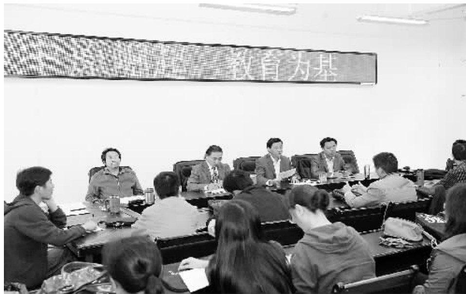
近期,信阳师院把学习十八大教育篇《中原崛起 教育为基》作为当前理论学习的重要内容,在全校掀起学习热潮。图为该院音乐学院党支部学习讨论现场。

液晶、东信蓝光、东森通讯等一批科技含量高的企业,走车间,访群众,同企业负责人亲切交谈了解项目进展情况和生产情况。