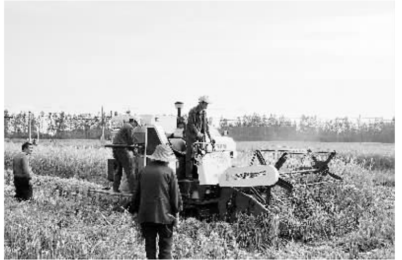
日前,息县水稻进入收割期。该县农机部门组织农机企业以产品推广的形式帮助困难群众收割水稻,受到群众的称赞。图为9月24日该县农机企业组织人员无偿为困难群众收割水稻。

截至目前,该分局共出动执法人员27人次、车辆12台次,共检查棉絮制品及床上用品经营户35户,发现有2户无照经营床上用品,已被立案查处,未发现辖区有销售“黑心棉”的情况。