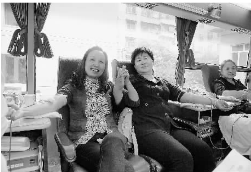
信阳日报社系统干部职工积极响应号召,主动履行公民义务,勇于担当社会责任,踊跃参加无偿献血活动。9月26日上午,在不到两个小时的时间,报社就有30余人参加了献血,献血量超过10000余毫升。图为报社职工正在献血。本报记者 郝光 摄

货单位资质和票据的合法性,从而杜绝从非法渠道购进特殊药品,确保了特殊药品从购进到经营使用过程的合法性。三查购进验收记录,查验特殊药品经营使用单位是否按照规定建立购进验收记录,看其保管的特殊药品购进验收记录是否按照规定做到认真履行购进验收义务,确保其购进、经营使用的每一批药品都得到认真检查验收。四查不良反应(事件)监测制度,查验特殊药品经营使用单位是否按照规定建立特殊药品不良反应(事件)监测制度,看其上报的不良反应(事件)报告表及上报时间。