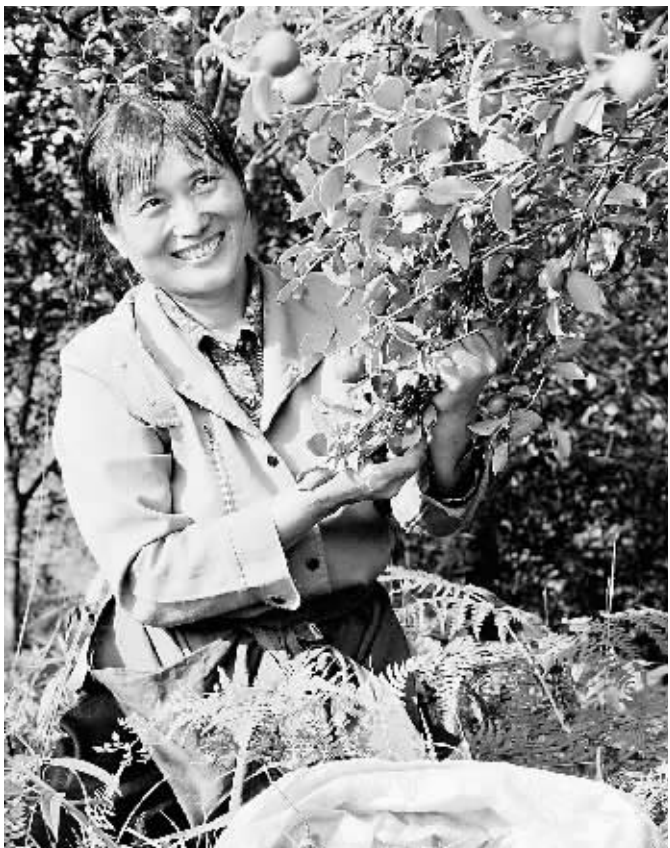
近日,新县10余万亩油茶喜获丰收,预计产量达到175万公斤,仅此一项,茶农增收就达2300万元。图为茶农喜摘油茶籽。焦汉平 余长根 摄

该区还向前来办事的群众发放民主评议和群众满意度测评表,对各窗口单位服务群众的情况进行民意调查,并将评议结果张贴在单位公开栏上。各窗口单位分管领导定期对窗口党员干部的服务态度、工作效率等进行点评,根据评价情况,对部分思想认识不足、工作不力的人员进行严肃处理。