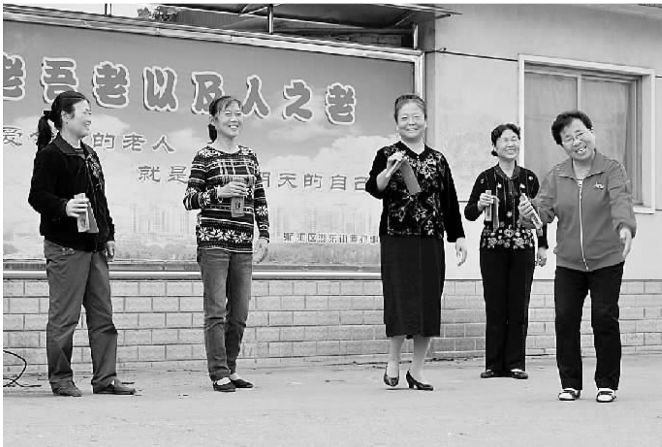
图为在浉河区湖东办事处报晓新村社区休闲广场上排练快板《夸女婿》的老年人。