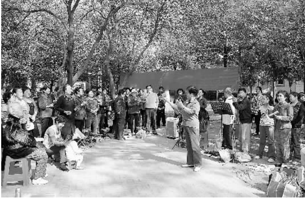
没有专业的舞台,没有华丽的灯光,更没有靓丽的服装,9月24日上午,在漯河公园上演了由我市中老年人组成的“激情广场大家唱”群众演唱会。一首首经典红歌此起彼伏,一段段动人的旋律让人激情澎湃,歌声、笑声、掌声、欢呼声在公园上空回荡,吸引着过往群众驻足倾听、跟唱。图为演唱会现场。

李湘豫认为,平桥区变化大、亮点多,关键在于打破常规,实现了快速发展。作为村级卫生室的发源地,平桥区全省领先;抓