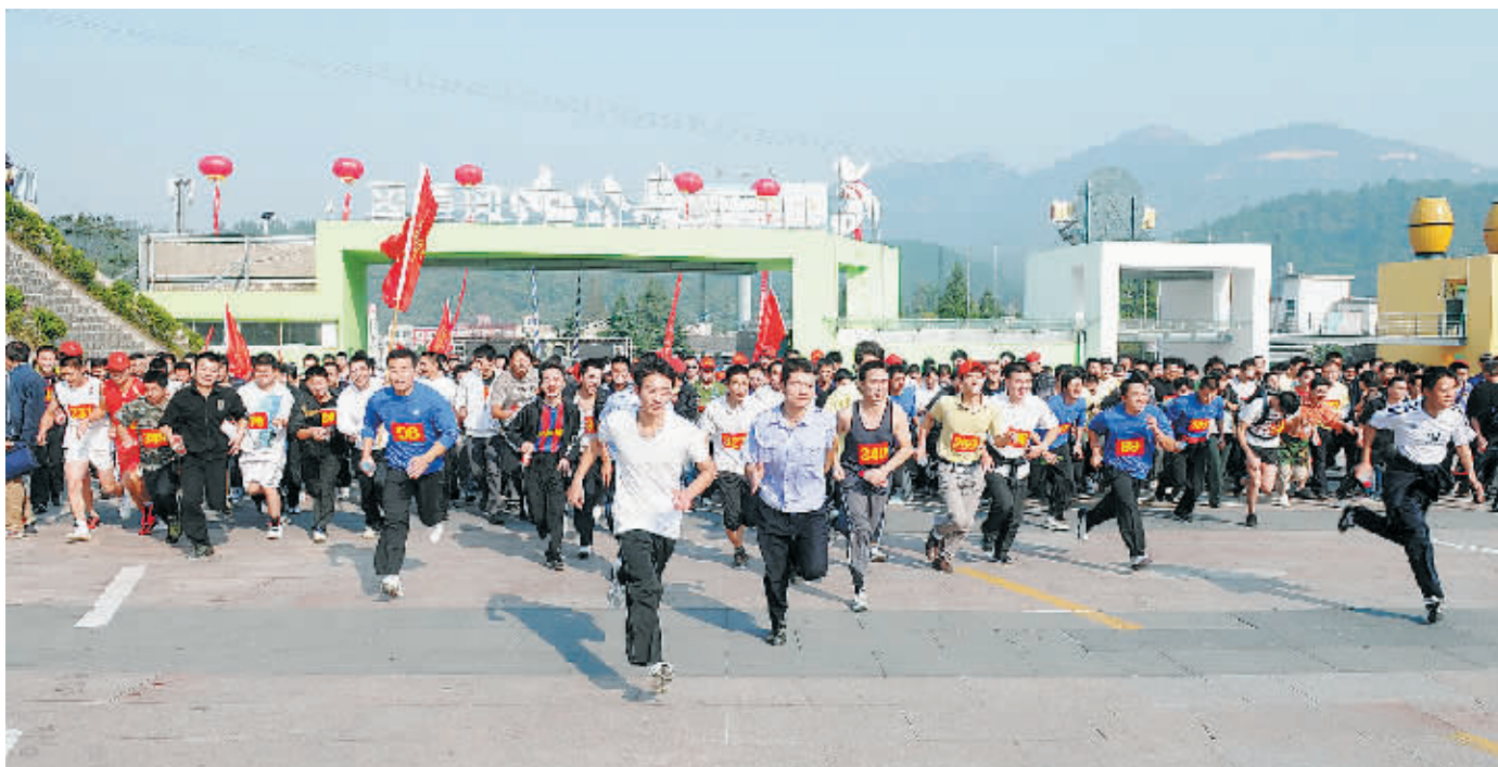
发令枪响,参赛选手争先恐后向鸡公山登山古道冲击。