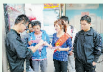
上图为驴速俱乐部的车友以骑游的方式宣传“无车日”。 左图为志愿者在发放无车日调查问卷。