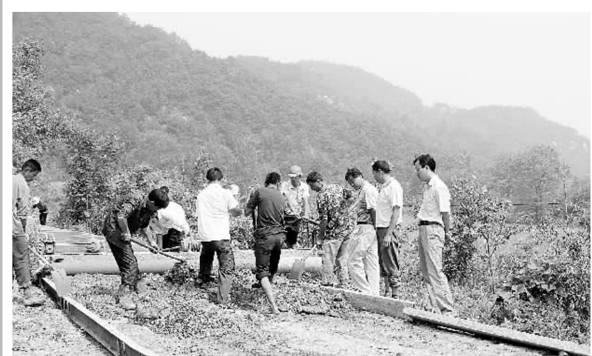
浉河区柳林乡堰冲村是该乡比较偏远的山村,长期以来,该村300多户1600多村民出行极为不便。今年以来,该乡把解决这个村的通路问题当成一件大事来抓,经过多方筹集资金,一条3公里的村组公路终于在近日开工。图为道路施工现场。

如果你开办的家政服务企业在当年新招用失业人员、转业退役军人、大中专毕业生、残疾人、农民工、被征地农民等人员达到企业在职职工总数30%以上,也可以按规定发放小额贷款并予以贴息。