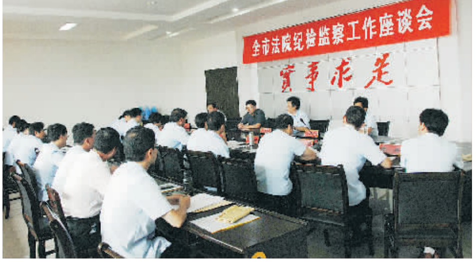
9月2日，全市法院纪检监察工作座谈会召开。会议传达了学习了2011年全省法院纪检监察工作会议精神和相关文件、规定，交流座谈了全市法院党风廉政建设、队伍建设、违法违纪案件查处等工作的经验做法以及目前工作存在的困难和不足，并对认真做好今后一个时期全市法院党风廉政建设和纪检监察工作提出了要求。图为座谈会现场。