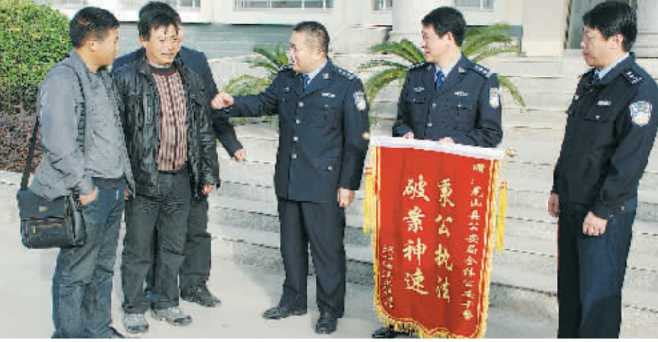
图为光山县公安局侦破盗窃收割机案后，群众自发赠送锦旗时的情景。