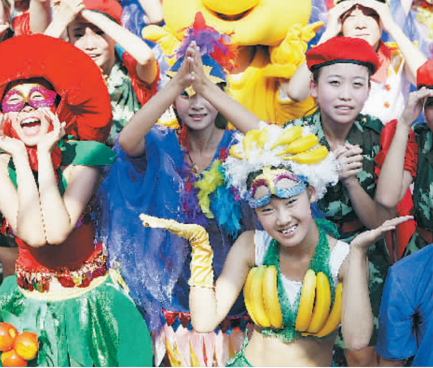
9月4日,巡游现场演员们热情欢呼。当日,作为第二届王府井国际品牌节活动之一的金宝街嘉年华巡游活动上演。本次嘉年华活动主题为“多彩金宝街 绚丽嘉年华”,700余名表演者组成的巡游方阵为观众带来了一场视觉盛宴。

气排放严重影响部分大城市的空气质量,部分大城市因交通严重拥堵,被迫出台限制牌照注册数量等影响汽车购置的措施。 苏波说,受多种因素限制,汽车行业不可能像过去十年那样持续高速增长,未来我国汽车发展必须寻找新的替代能源,发展节能与新能源汽车是大势所趋。 近年来,国家大力推动节能汽车,鼓励小排量汽车,汽车油耗明显降低。尤其是2010年6月实施的节能汽车推广政策,极大地促进了节能与新能源汽车的技术进步和产品的结构调整。