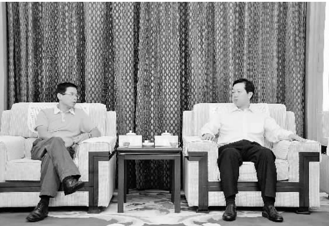
8月30日上午,市长郭瑞民在市行政中心亲切会见了中国港中旅集团公司副总经理许慕韩一行,双方就进一步推进鸡公山文化旅游合作项目建设进行了深入交流和沟通。市委常委、宣传部部长、副市长张春香会见时在座。