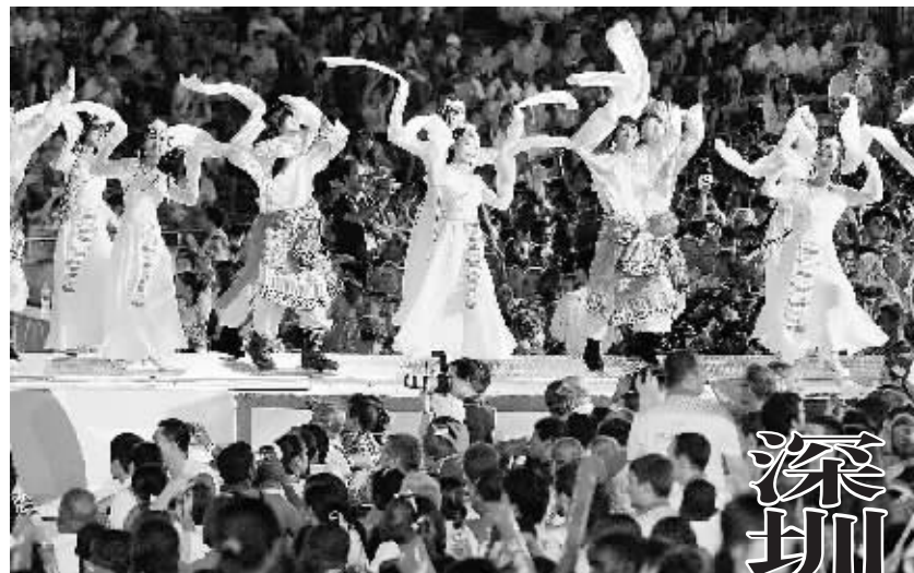
8月23日,第26届世界大学生夏季运动会闭幕式在深圳举行。这是闭幕式现场。

土地管理制度改革,健全严格规范的农村土地管理制度,加快征地制度改革,深化国有土地有偿使用制度改革,加强土地行政管理能力建设。 胡锦涛强调,各级党委和政府要把土地管理工作纳入重要议事日程,建立健全党委领导、政府负责、部门协同、公众参与、上下联动的工作格局,建立健全耕地保护责任考核体系,严格土地管理责任追究制。国土资源管理部门要积极主动服务,不断提高土地管理工作水平,各有关部门要密切配合,加强统筹协调,形成工作合力。要严格遵守土地管理法律法规和法定程序,依法管地用地。要深入开展土地资源国情和土地法律法规宣传教育,普及保护耕地和节约用地基本知识,使全社会都深刻认识我国国情和保护耕地的重大意义,使保护耕地、节约用地观念深入人心,广泛形成保护耕地、节约用地的良好社会氛围。