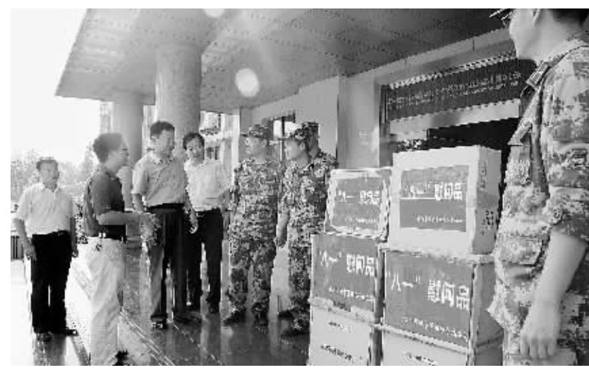
7月26日上午,市城市管理综合执法局领导班子一行,前往解放军第一五四医院、驻信71872部队走访慰问驻地官兵,并送去了慰问金、丰富的慰问品和美好的祝福。驻信部队领导表示,把驻地当故乡,以建设信阳、发展信阳、造福信阳为己任,为信阳经济发展和社会稳定作出新的贡献。上图、左图为慰问时的情景。