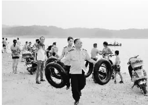
图为执法人员对饮用水水源保护区进行整治时的情景。

本报(记者 杨柳)盛夏到来,为遏制部分市民进入南湾湖饮用水水源保护区就餐和游泳的苗头,严厉打击在饮用水水源保护区内游泳等违法行为,7月21日至23日,南湾湖风景区管委会联合市环保局,组织辖区公安、工商、水利、环保、渔政、卫生、城市执法等部门,重拳出击,开展了饮用水水源保护区专项整治行动。