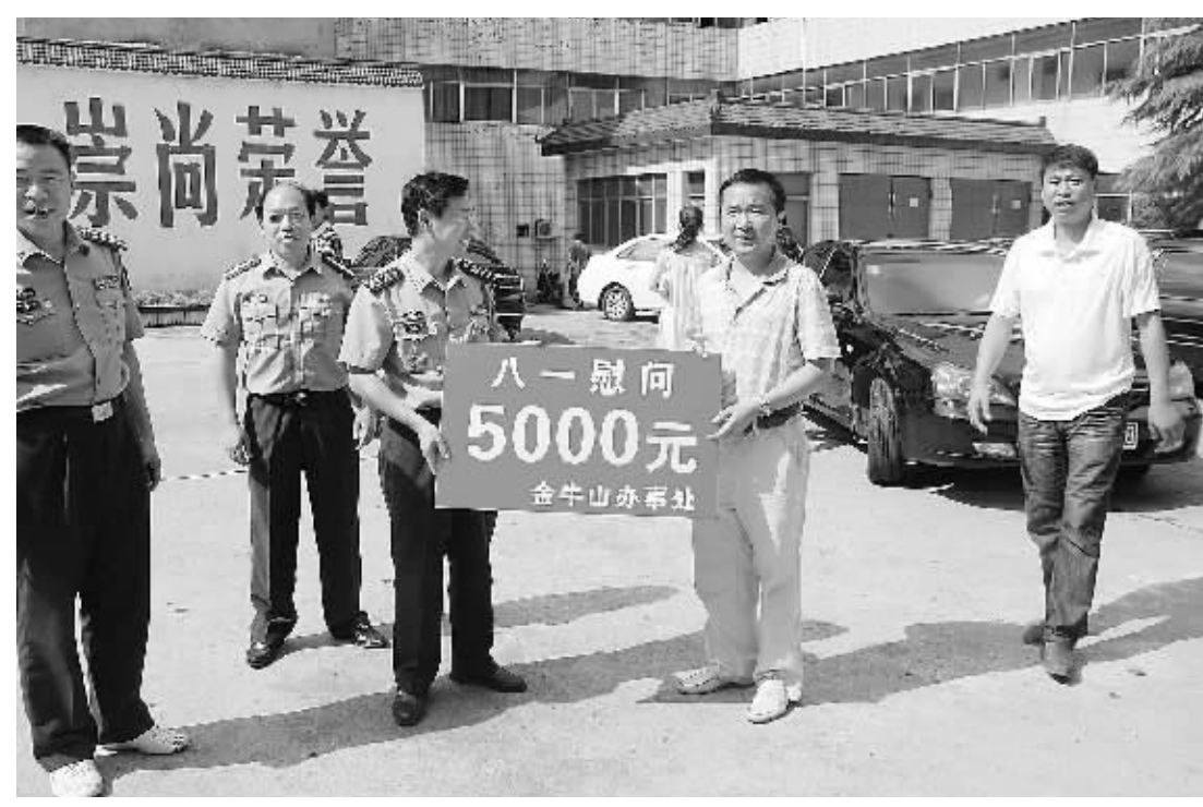
“八一”建军节到来之际,浉河区金牛山办事处负责人组织民政和双拥办的工作人员,带着慰问金和价值3万余元的慰问品,前往辖区驻军部队走访慰问。同时,通过军地座谈等形式,广泛征求部队意见,共议双拥大计。图为慰问时的情景。