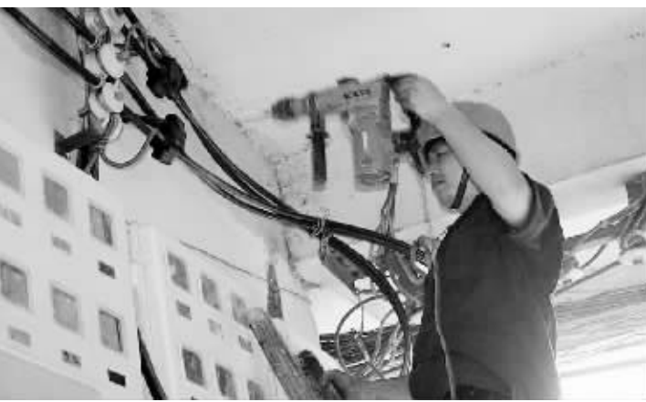
7月24日下午6时许,光山县电业局解放街配电站区管理员在巡视设备时发现,因用电负荷突然增大,导致城区部分商户供电线路冒烟燃烧。该局抢修人员接报后,及时赶赴现场抢修,30分钟后即恢复送电,受到商户们的一致好评。图为抢修时的情景。

对拒不参保、拒缴、少缴失业保险费的用人单位,市人力资源和社会保障局将加大执法力度。8月中下旬,市区经办机构将联合对重点、难点单位,进行书面、电话、上门征缴稽核、催缴。任何拒绝、阻挠失业保险部门开展监察与稽核的单位和个人,将依据相关规定,承担相应的法律责任。