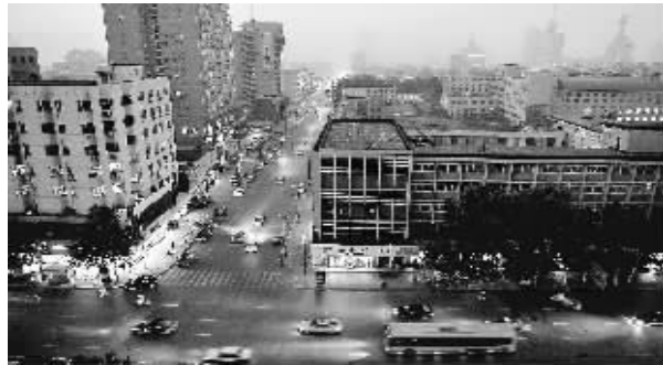
7月26日,郑州市区白昼如夜。新华社记者 王頌 摄

据新华社郑州7月26日电(记者 张兴平)7月26日,郑州市在接连发布两个气象预警信号之后,于当天下午迎来一场罕见强对流天气,大雨雷电交加。由于阴云密布,整个城区陷入一片黑暗,出现白昼如夜景象。