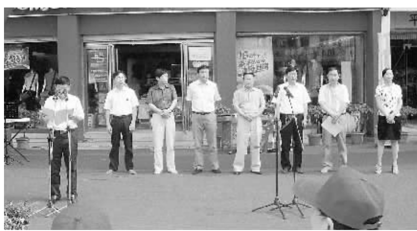
7月21日,浙河区在五里墩办事处八一社区举行“大爱有行——关爱空巢老人志愿服务行动”启动仪式。图为启动仪式现场。