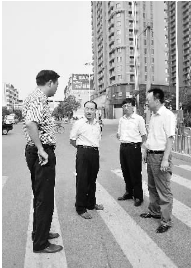
近日,浙河区市政管理局执法局强化落实包路责任制,推进白坡路环境整治,图为整治现场。

小公厕,大民生。四通八达的道路、鳞次栉比的高楼、环境优雅的公园、布局合理的公厕,无不体现我们这座城市的文明、进步、魅力。作为城市规划、建设的出发点和落脚点,小小城市公厕恰恰体现其在服务民生、便民利民上。或许,在我们创卫的答卷上,公厕的“分值”并不大;或许,在建设魅力信阳的图画上,公厕的“分量”并不重,但作为城市建设的公厕设施本身是人文景观之一,是毋庸置疑的。2001年11月,世界厕所高峰论坛明确提出“不重视厕所卫生的国家(城市)没有文化和未来”这话不无道理。一座城市的功能是否配套完善,公共厕所则是标志之一,从某种角度上讲,不但关乎整个城市的形象,而且关系广大人民群众的日常生