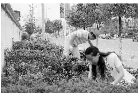
近日,平桥区平西办事处干部职工清除杂草的情景。