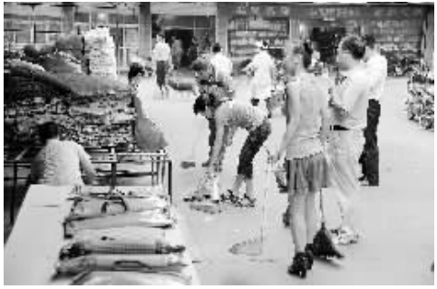
连日来,市人防办干部职工到新华大市场,打扫责任区段的卫生。图为整治现场。