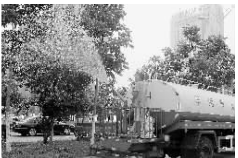
近期,我市中心城区的园林工人为行道树喷洒药物的情景。