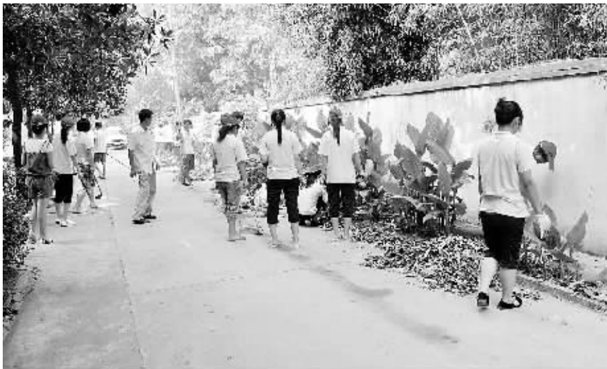
7月22日,信阳创卫志愿者到南湾风景区打扫景区卫生...