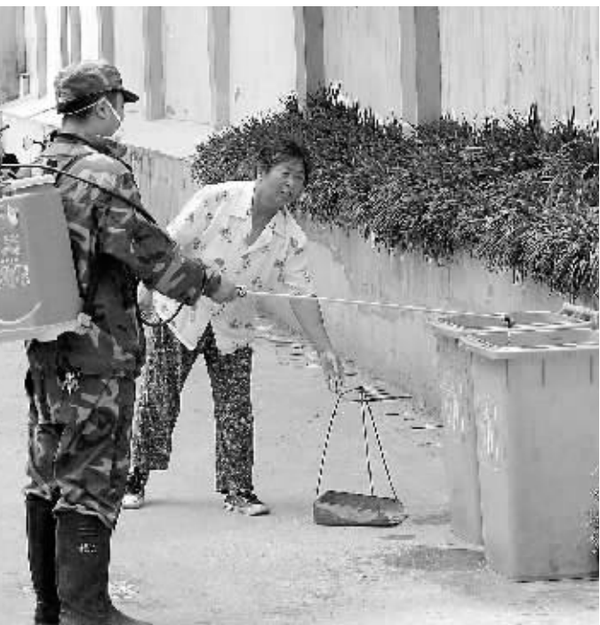
为了预防控制病媒生物,为广市民创造一个健康安全的生活环境,近日,泌阳县湖东办事处扎实开展“除四害”等病媒生物防治消杀工作...