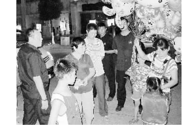
图为在执法队员的帮助下，走失的小女孩终于找到了妈妈。