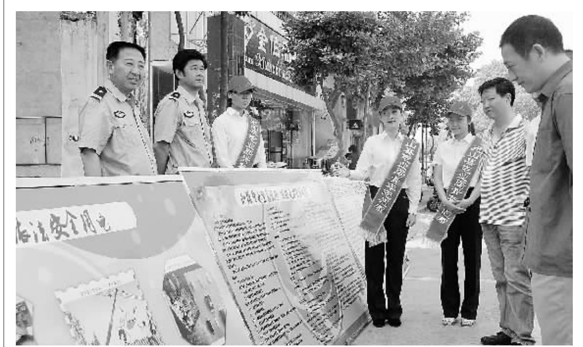
为确保夏季安全供电，近日，光山县电业局联合公安机关，在县城繁华路段开展打击盗窃、破坏电力设施，规范用电秩序专项宣传活动，受到群众的欢迎。图为宣传活动现场。

市民张先生告诉记者，自创卫以来，整个中心城区干净整洁了，我住着也舒服。特别是家属院的邻居们晚上乘凉时都在议论这件事，大伙都希望我们的城市越来越好，真正成为文明卫生城市。