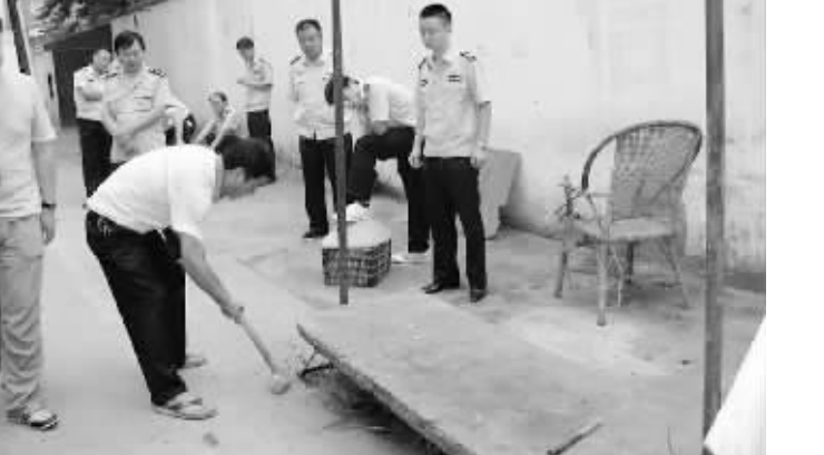
图为临街违规简易棚被依法拆除。