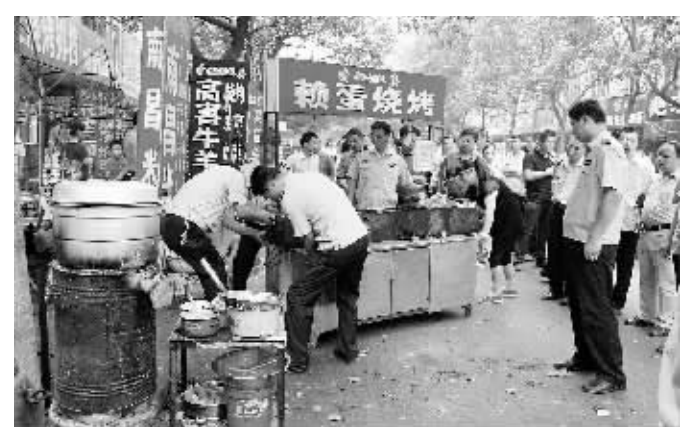
7月19日,浉河区组织胜利路、建设路牵头单位对小南门区域进行了集中整治。图为整治时的情景。