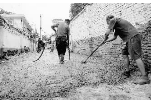
最近,羊山新区南京路办事处全民动员,积极创卫,组织工作人员对辖区的背街小巷进行整治。图为该办事处治理背街小巷时的情景。