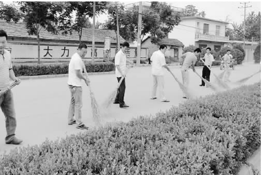
为认真落实息县县创卫工作目标,确保拥有一个绿色、环保、净美的工作和生活环境,息县电业总公司按照县创卫工作安排,积极开展环境整治活动。图为日前该公司组织员工对西大街工区路路面和花圃带进行认真清理,以实际行动给力创卫工作,建设美好家园。

原来,信阳工业城供水系统由于涉及跨京港澳高速中环路立交桥大型工程的施工问题,要进行线路的调整及检修,需要停水一天,由于华仪电气有限公司刚刚搬迁到工业城进行试生产,车间的生产设备尚在调试过程中,厂区储水设施安装也没有到位,未能及时储水。这可急坏了华仪公司的管理层,没有水,员工食堂没法做饭,近200名员工吃饭就成了大问题,天气又非常炎热,工人们还需要抓紧时间生产,一旦停水,工人们连饮用水都没有。怎么办?心急如焚的企业负责同志脑海里浮现出项目建设期间,信阳工业城工作人员忙碌的身影,于是果断地拨通了信阳工业城的电话。工业城项目管理局局长陈伟和消防科科长郑伟接到电话后,第一时间来到了企业,了解情况。企业生产是大事,工人吃水更是大事,由于辖区消防特勤大队正在建设中,消防设施暂未投入使用,郑伟立即与距离工业城辖区最近的平桥消防大队取得了联系,经过积极的沟通协调,得到了消防大队的全力支持,不到半小时2辆满载8吨清水的消防车驶进公司大门,停水期间累计为企业运送清水5车40吨,解了燃眉之急。