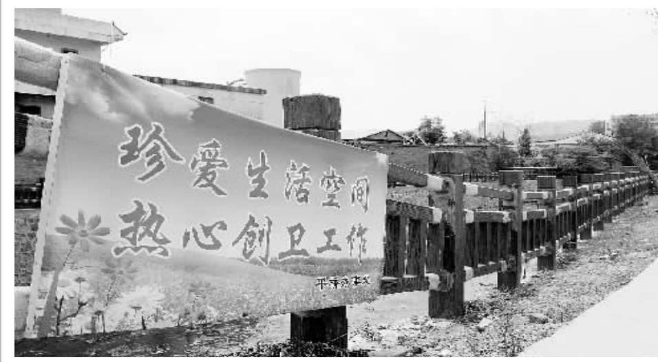
为推进创卫工作深入开展,连日来,平桥区平桥办事处投入大量人力、物力、财力,建文明墙、粉刷旧墙面,修补破损路面,悬挂宣传标语,进一步美化城区环境,提升城区形象。图为该办事处在辖区内河电西沟处设置的宣传标语。本报记者 杨柳 摄