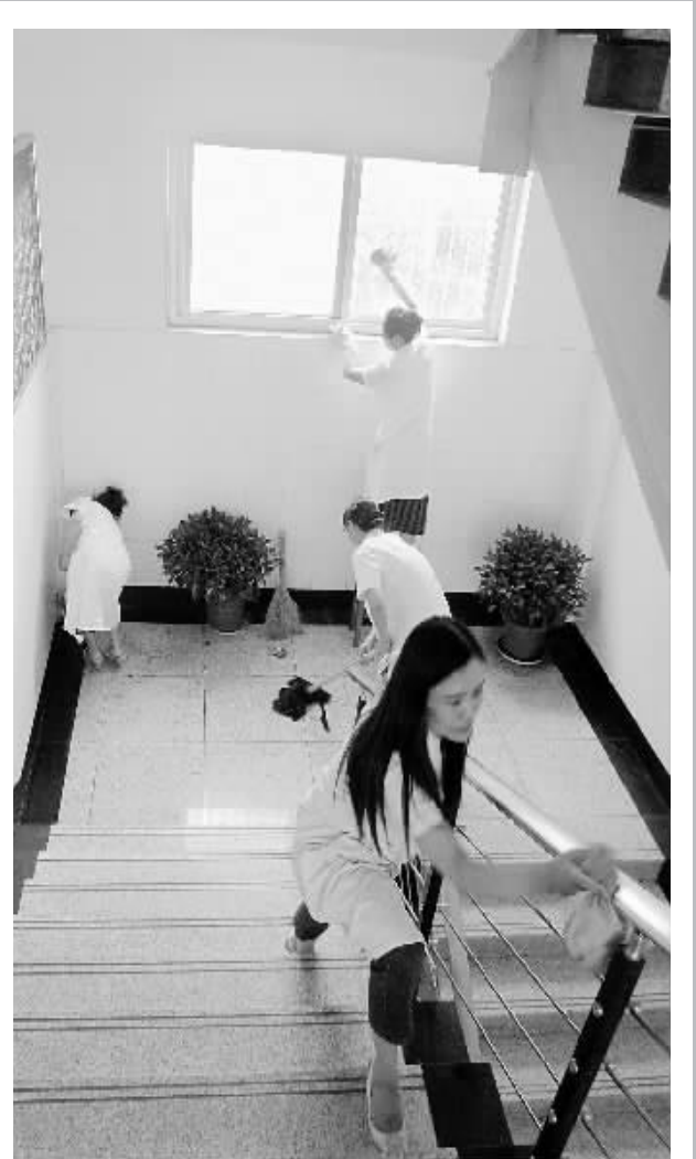
连日来,市精神病院医务人员全力投入到创卫工作中,制定创卫攻坚方案,制作卫生知识宣传板,为职工和住院病人举办健康知识讲座,彻底清理院内的卫生死角,进一步美化了医院环境。图为医务人员正在打扫卫生。