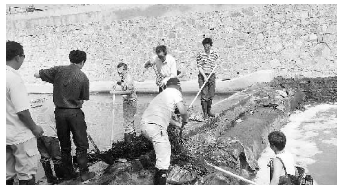
图为工人们正在清理污水截污口的漂浮物和污泥。

本报讯(记者 周海燕)6月29日,市污水处理公司43名员工,在公司领导的带领下,来到市中心城区的黑泥沟污水截污口,穿着防水衣,跳进齐腰深的污水汇集处,打捞截污口的漂浮物和下沉的污泥。面对难闻的气味、炎热的高温,工人们说:“创卫攻坚,责无旁贷,我们就是要用实际行动践行创卫诺言。”