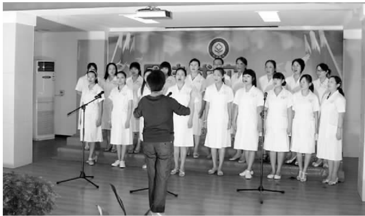
6月28日下午,信阳职业技术学院附属医院隆重举行纪念建党90周年红歌会。信阳职业技术学院的领导、我市著名的新说组合、阳光艺术社及该院近400名职工参加了红歌会,他们用歌声唱出了“永远跟党走”的时代强音。图为红歌会现场。

吴月桥、胡启民二位老干部对党和政府的关心表示衷心感谢,希望市疾控中心为我市创建国家卫生城市做出更大的贡献。