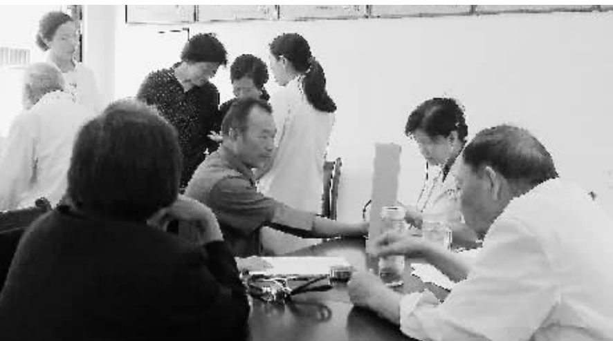
“七一”前夕,南湾湖风景区、南湾卫生院组织党员和医疗技术人员,为辖区1000多名老人免费体检、建立健康档案。图为体检现场。

首例矢状窦旁脑膜瘤切除术的成功实施,标志着我市神经外科技术发展又迈上了新的台阶。