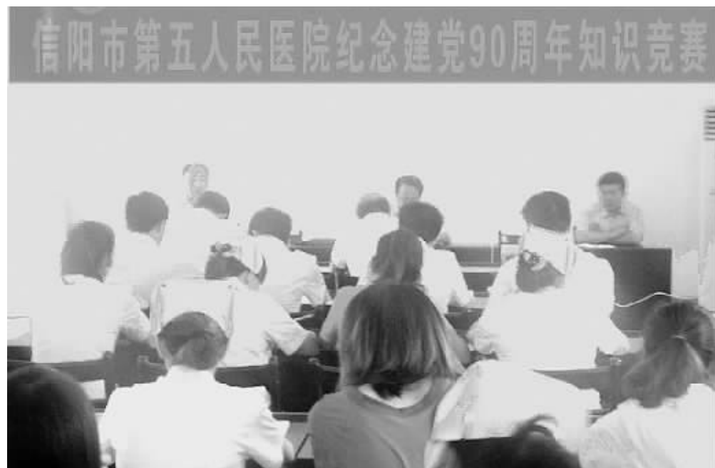
6月27日,市第五人民医院举办“纪念中国共产党建党90周年知识竞赛”,该院25名党员和部分入党积极分子参加了竞赛。图为知识竞赛现场。

走进社区义诊惠民。为了加大对信阳妇幼保健事业的帮扶,郑大三附院暨省妇幼保健中心将优质的医疗保健服务带到信阳群众身边。他们与市第一人民医院合作,建立了河南省妇幼保健院信阳分院,组织专家团队举行大型义诊活动。目前,两家医院专家已义务为我市万余名群众进行了义诊咨询服务,受到市民的称赞。