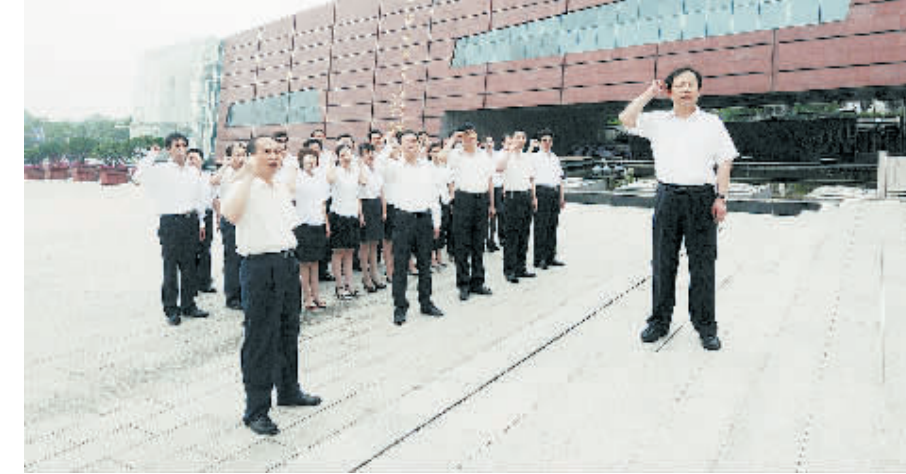
日前,为庆祝建党90周年,工行信阳分行组织部分党员干部参观鄂豫皖革命纪念馆,并接受革命传统教育。图为该部分党员干部重温入党誓词时的情景。

经过各县区、各单位层层选拔和筛选,共有12名选手进入了总决赛。通过演讲,各位选手展示了出类拔萃的演讲才能,显示了他们爱党爱国的高尚情怀和昂扬向上的精神风貌。经过两个多小时的比赛,大赛决出了特等奖、一等奖、二等奖、三等奖、优秀奖和组织奖(名单见A2版)。