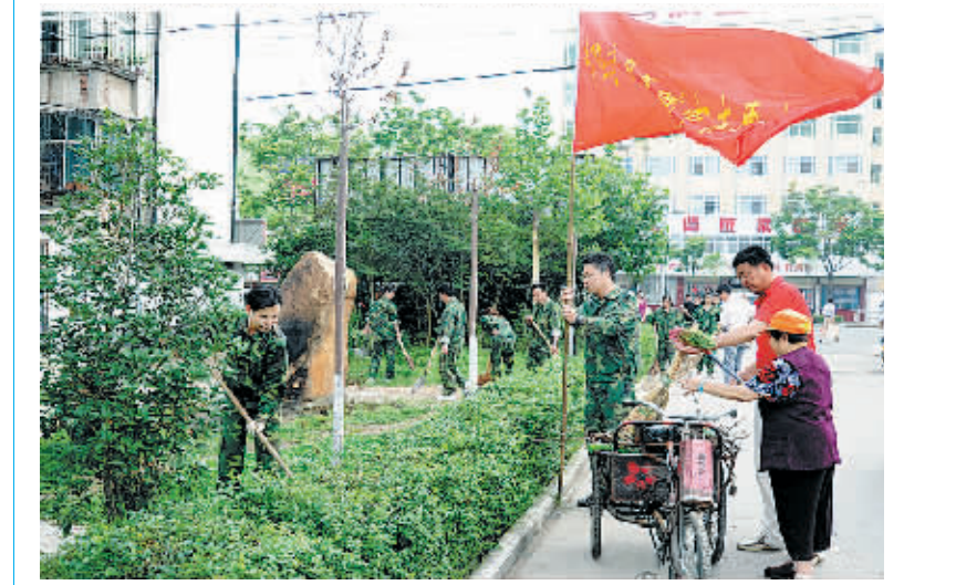
日前,羊山新区南京办事处组织部分党员干部、干部职工及部分群众成立了“创国家卫生城市志愿者分队”,对创卫工作中的薄弱环节和突出问题,进行集中整治。

强力推进创卫工作,做到人员到位、措施到位、经费到位、责任到位。一是区创卫办根据国家爱卫办提出的意见建议制定了整改督查通知,下发给各有关单位,要求各单位引起高度重视,明确分工,细化责任,认真抓好各项任务的落实。二是各责任单位积极硬化居民道路,完善环卫设施,