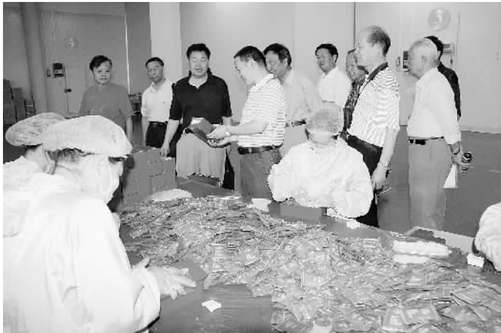
为宣传信阳茶,弘扬茶文化,日前,市老年诗词研究会16名会员来到文新茶叶公司调研和采风,现场创作诗歌100余首,讴歌我市茶产业的发展和“信阳红”的成功实践。图为会员们在文新茶叶公司生产车间参观时的情景。

部对专家围绕如何当好党支部书记、加强党支部建设,如何发挥党支部的战斗堡垒作用和党员的先锋模范作用及创先争优等方面所作的理论辅导给予高度评价,不时报以热烈的掌声。他们普遍反映,这次培训班举办得很好,很有必要,切合实际,做到了课堂教学与现场观摩相结合、集中学习与分组讨论相结合、理论学习与交流体会相结合,营造了良好的学习环境和氛围,充分调动了大家学习研讨的自觉性、积极性,增强了学习效果。离退休老干部们纷纷表示,将以参加这次培训班为契机,进一步加强本单位离退休老干部党支部建设,积极发挥作用,为我市的经济社会发展再立新功。