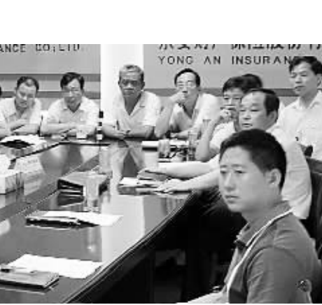
日前，市环卫处召开创卫整改动员会议。图为与会人员观看有关创卫录像资料的情景。

除和周六照常上班的要求，联系社区科级干部和职能部门工作人员深入社区全程参与创卫整治，社区居委会分行业召开辖区单位创卫座谈会，充分整合辖区单位资源开展创卫攻坚。同时，制定社区班子成员和居民组长创卫责任制，特别是针对背街小巷、农贸市场、排档市场、骑路市场、公厕等处加大整治力度。此外，该办事处规划建设