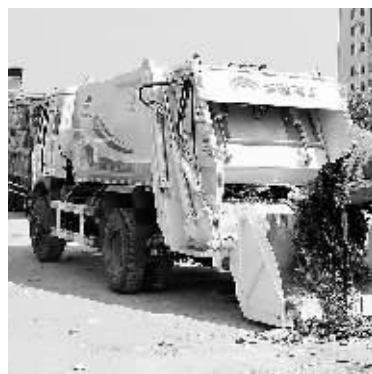
近期，平桥区投资800多万元建设垃圾转运处理工程，为下一步创卫攻坚打下基础。图为该市政管理部门清理垃圾的情景。

此外，该办事处以社区为单元，强化督查，严格落实周五下午大扫除和周六照常上班的要求，联系社区科级干部和职能部门工作人员深入社区全程参与创卫整治，社区居委会分行业召开辖区单位创卫座谈会，充分整合辖区单位资源开展创卫攻坚。同时，制定社区班子成员和居民组长创卫责任制，特别是针对背街小巷、农贸市场、排档市场、骑路市场、公厕等处加大整治力度。此外，该办事处规划建设