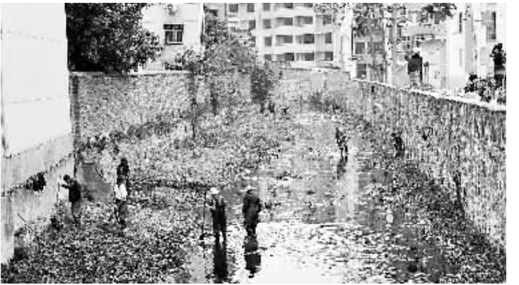
从5月中旬开始,浉河区五里墩街道办事处对中环路至中山路段长约1.5公里的新中河河道实施清理,目前清理河道300多米,清理杂草8车,淤泥20多车。

本报讯(余霞 杨国良)汛期来临之际,平西办事处提前部署内河卫生保洁及清淤清障防汛防涝事宜,确保辖区安全度汛和人民群众的生命财产安全。 该办事处将辖区陆湾水库、浉河、平西沟清淤清障工作分包到班子成员,由班子成员包片、包段,责任落实到具体人;同时加大巡查力