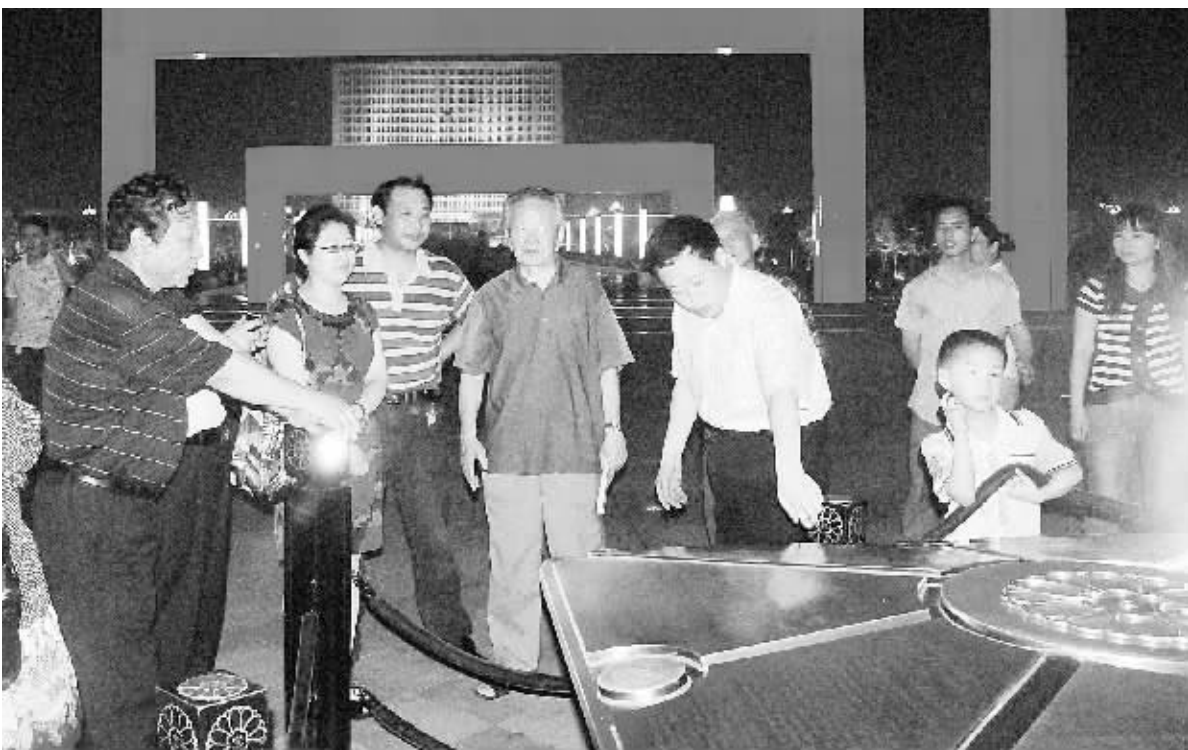
河南省第十六届黄河诗会在信阳召开。6月11日夜,70多位享誉中原的诗人、诗刊编辑们争相一睹盛夏之夜魅力信阳百花图的芳容。