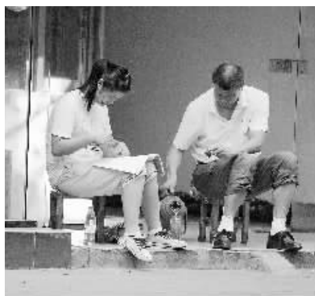
细心的父亲陪着待考的女儿做考前的准备。