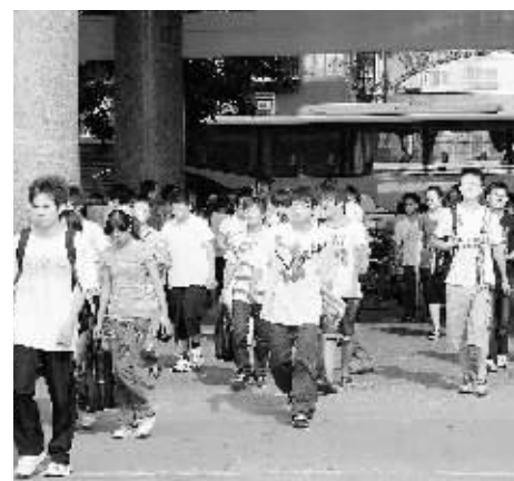
考生们走进考场。