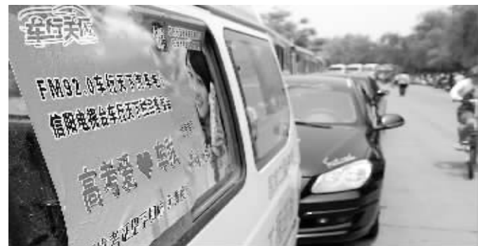
图为整装待发的爱心车队。