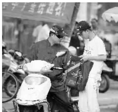
父亲骑车送孩子到考场后还不忘叮嘱几句。