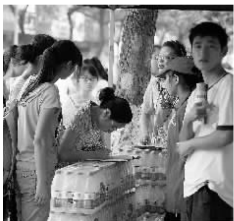
一些企业免费给考生发放纯净水。