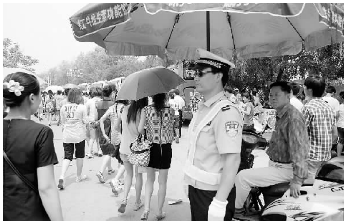
图为交警冒着高温为高考维护交通秩序。

中等考点门口看到,一些企业在为考生和交警发放饮料、扇子等防暑降温用品,自发成立的爱心车队也在义务接送考生。这一切都使紧张的高考充满了浓浓的人情味,也折射出社会对莘莘学子们的关爱之情。